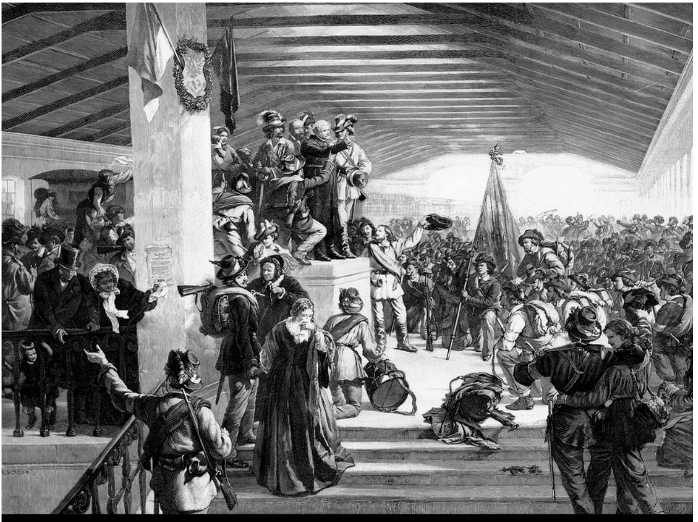
Haspinger segnet auf dem Wiener Südbahnhof die zur Landesverteidigung ausziehenden Tiroler Studenten (1848).

... oder wie sich die große Zeitgeschichte auch in der Provinz bemerkbar macht.