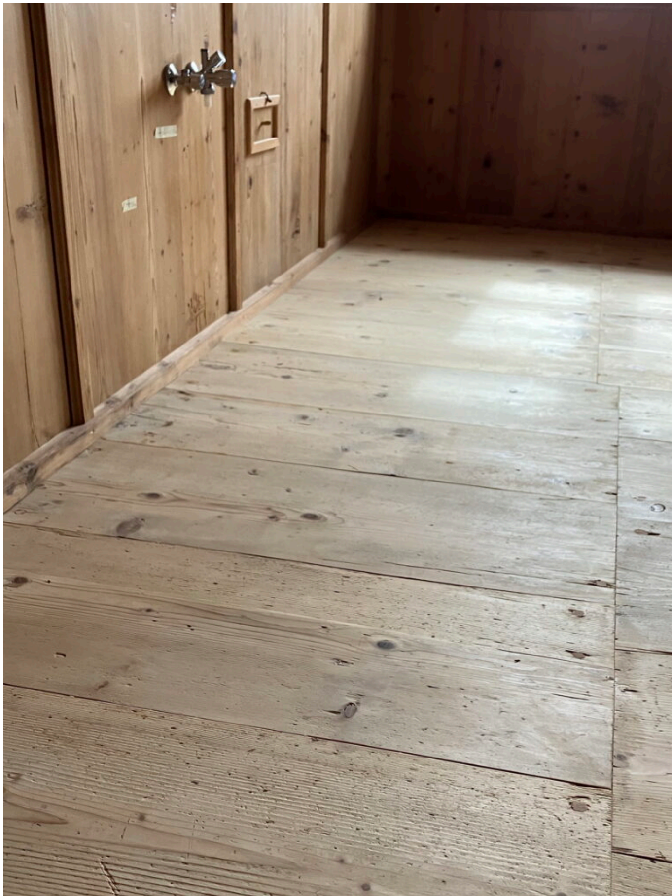
Die kurzen Bretter des Riemenbodens in der nordseitig gelegenen Kammer (4).