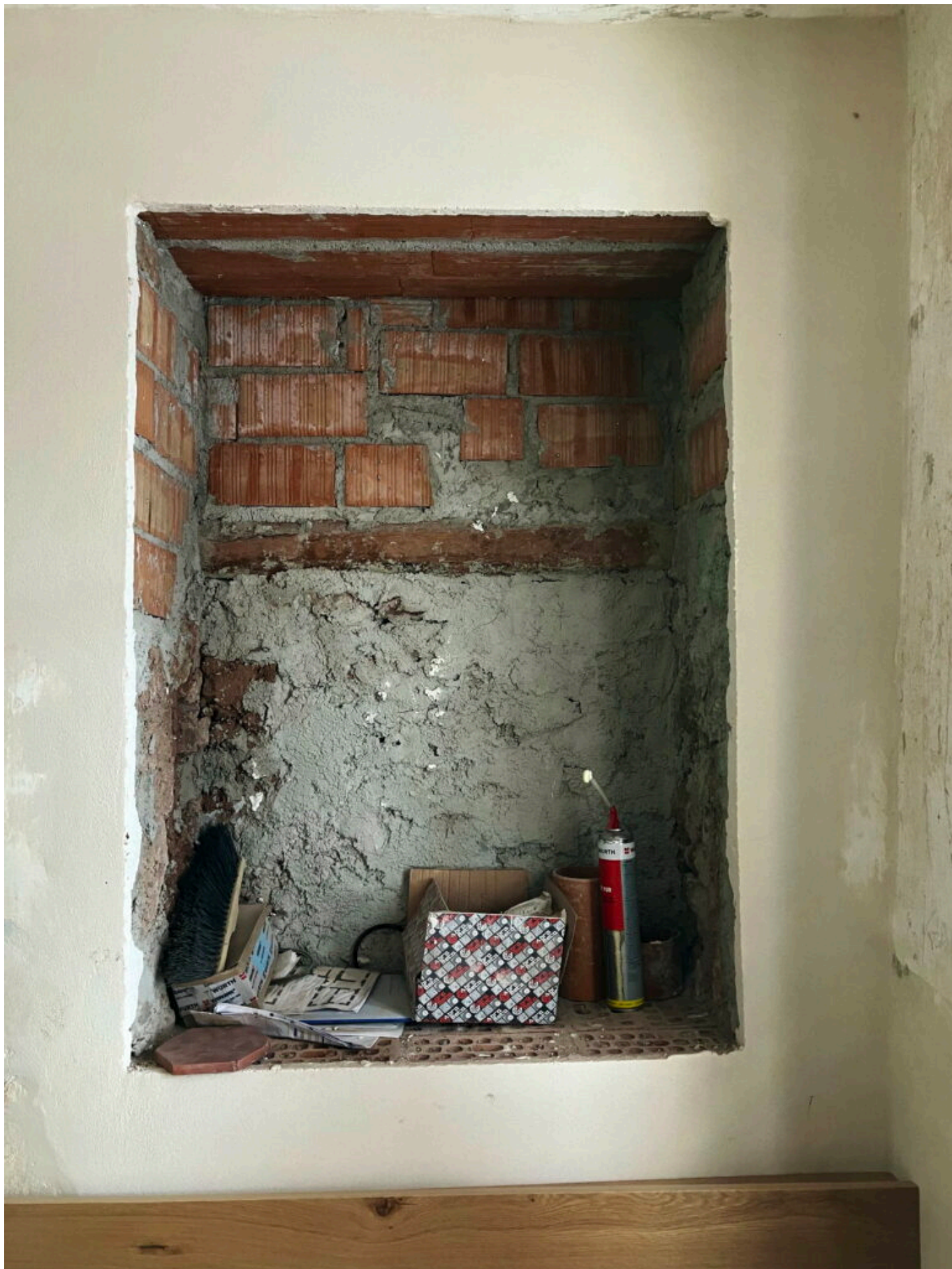
Auch hier ein zugemauertes Fenster, dies Mal in der Speis, dessen Aussparung später als Ort für einen Wandschrank genutzt wurde (3).