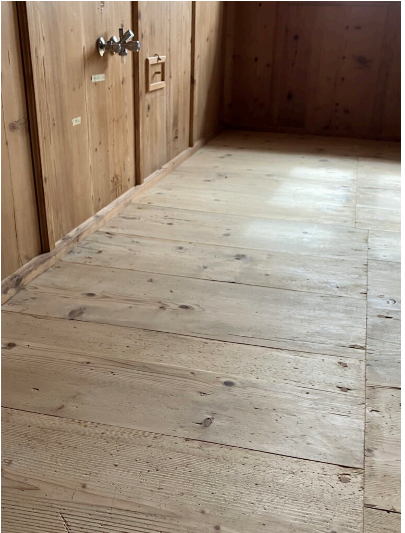
Die kurzen Bretter des Riemenbodens in der nordseitig gelegenen Kammer (4).