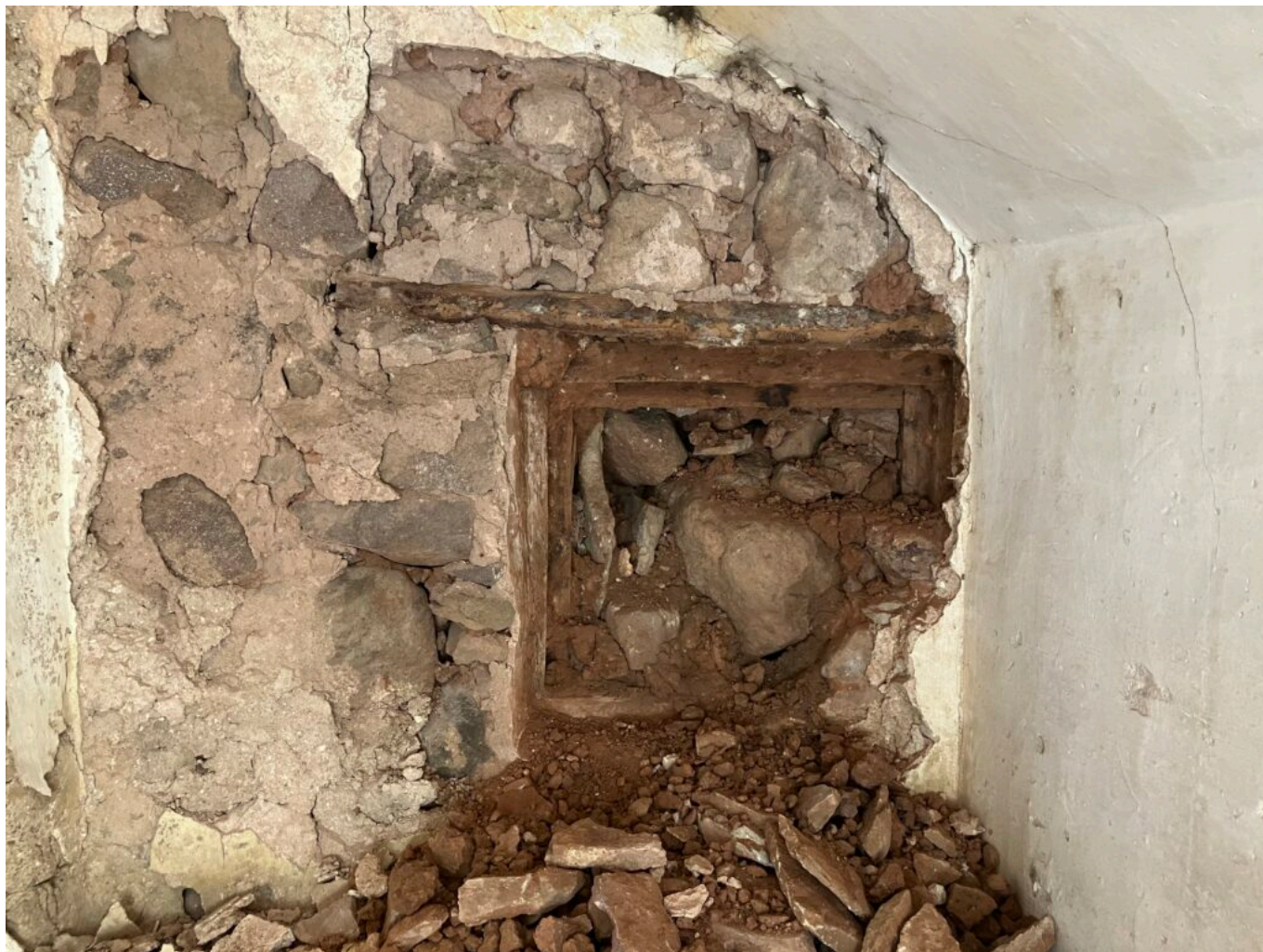
Das zugemauerte Fenster unter der Stiege (1).