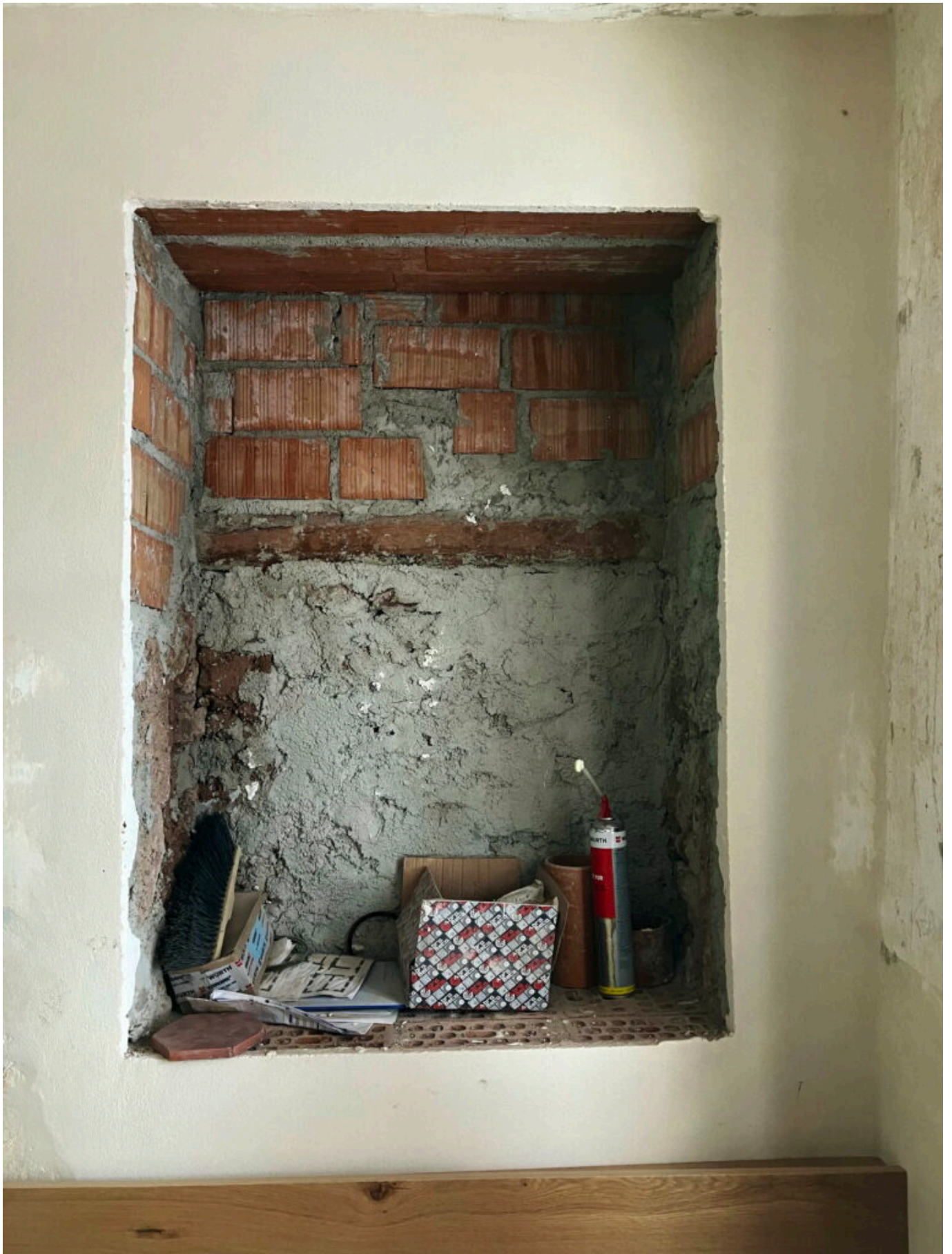
Auch hier ein zugemauertes Fenster, dies Mal in der Speis, dessen Aussparung später als Ort für einen Wandschrank genutzt wurde (3).