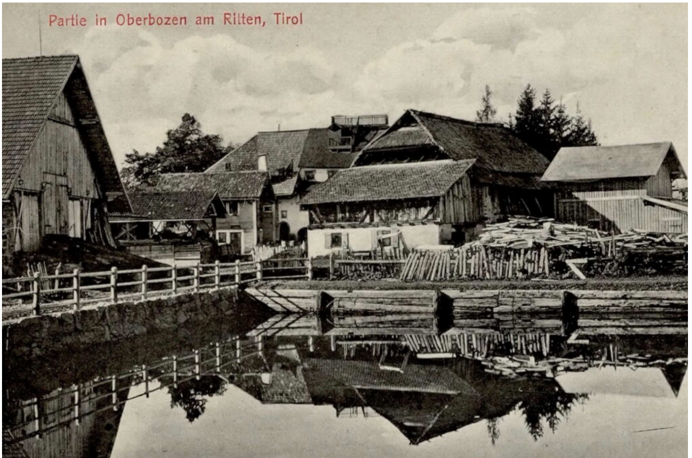
Abb. 1: Das Zentrum von Maria Schnee in Oberbozen, dargestellt auf einer ungeraisten Ansichtskarte aus dem Verlag J.F. Amonn, welche den Stempel „Hôtel Oberbozen am Ritten bei Bozen, Tirol, 1200 m. ü. d. M.“ trägt.

Diese Ansichtskarte (Abb. 1) konnte ich online zum Ausrufepreis ersteigern, niemand sonst aus Sammlerkreisen hat sich nach über einem Monat, wo sie ausgestellt war, dafür interessiert. Jetzt bin ich überglücklich, denn seit Beginn meiner Recherchen war da so ein großer, weißer Fleck in der bildlichen Darstellung der Siedlungsgeschichte von Maria Schnee.