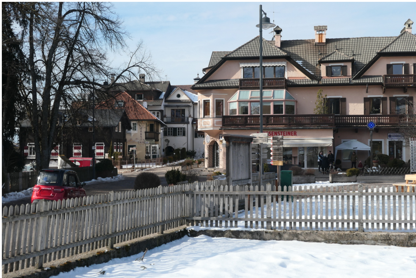
Abb. 5. Durch das Ziehen am Regler kann man das Rad der Geschichte, zumindest visuell, um über 110 Jahre zurückdrehen.

Gegenüber der Katastermappe ist der Oberhoferstadel auf dem Foto in den 50 Jahren dazwischen um einige Anbauten deutlich vergrößert worden. Verglichen mit heute war das Babsi-Gebäude noch kleiner und länglicher, die ehemalige Dependence des Hotel Post, links daneben, hat ihre Form behalten, war aber früher ein an den Seiten offenes Schupfe, könnte aber auch einmal die überdachte Kegelbahn des Gasthofs Unterhoferstadel gewesen sein. Bis vor wenigen Jahrzehnten hatte nämlich fast jeder Land- und Bergasthof eine solche. Der Unterhoferstadel ganz links hat zuerst dem Musikpavillon Platz gemacht, später hat sich die Vegetation des Hotel-Post-Parkes sich den Platz zurückgeholt. An den Teich kann ich mich selbst gut erinnern, um Mitte der 2000er Jahre wurde er leider zugeschüttet.