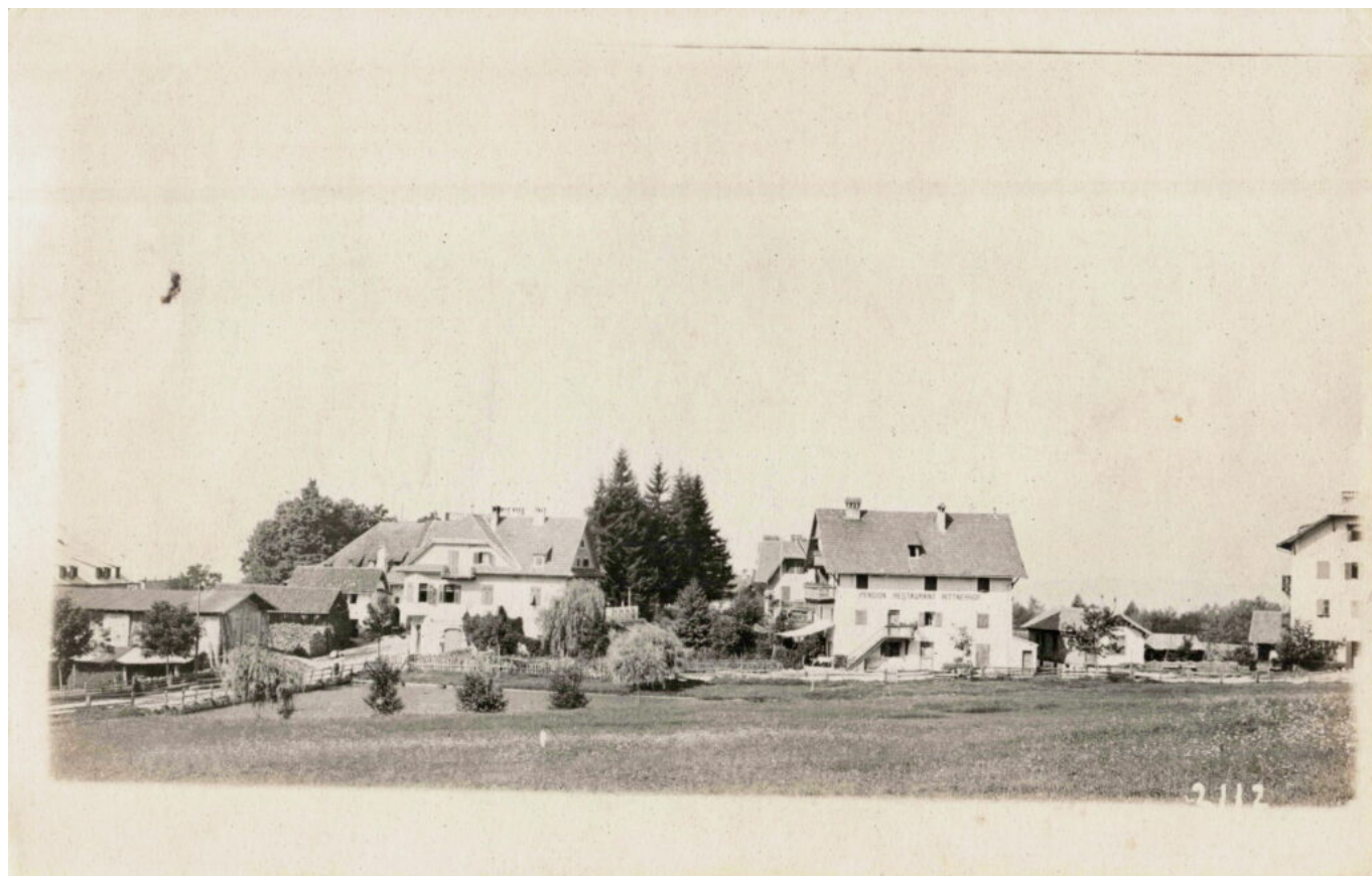
Abb. 3: Der Dorfkern von Maria Schnee zeigt sich 1919 schon stark verändert (Fotografie). Der Stadel des Unterhofers ganz links sieht deshalb anders aus als in Abbildung 1, da er 1913 abgebrannt ist und in veränderter Form wieder aufgebaut wurde.

Oberbozner Grund- und Bauverein errichtete Gebäudekomplex (früher Baumgartner/Prock, heute Tutti Patschengele/Weissensteiner) erkennbar (Abb. 3). Der Wunsch war groß, biidhaft einen vor gar nicht so langer Zeit vergangenen Zustand, der über mehrere Jahrhunderte herrschte, darstellen zu können.