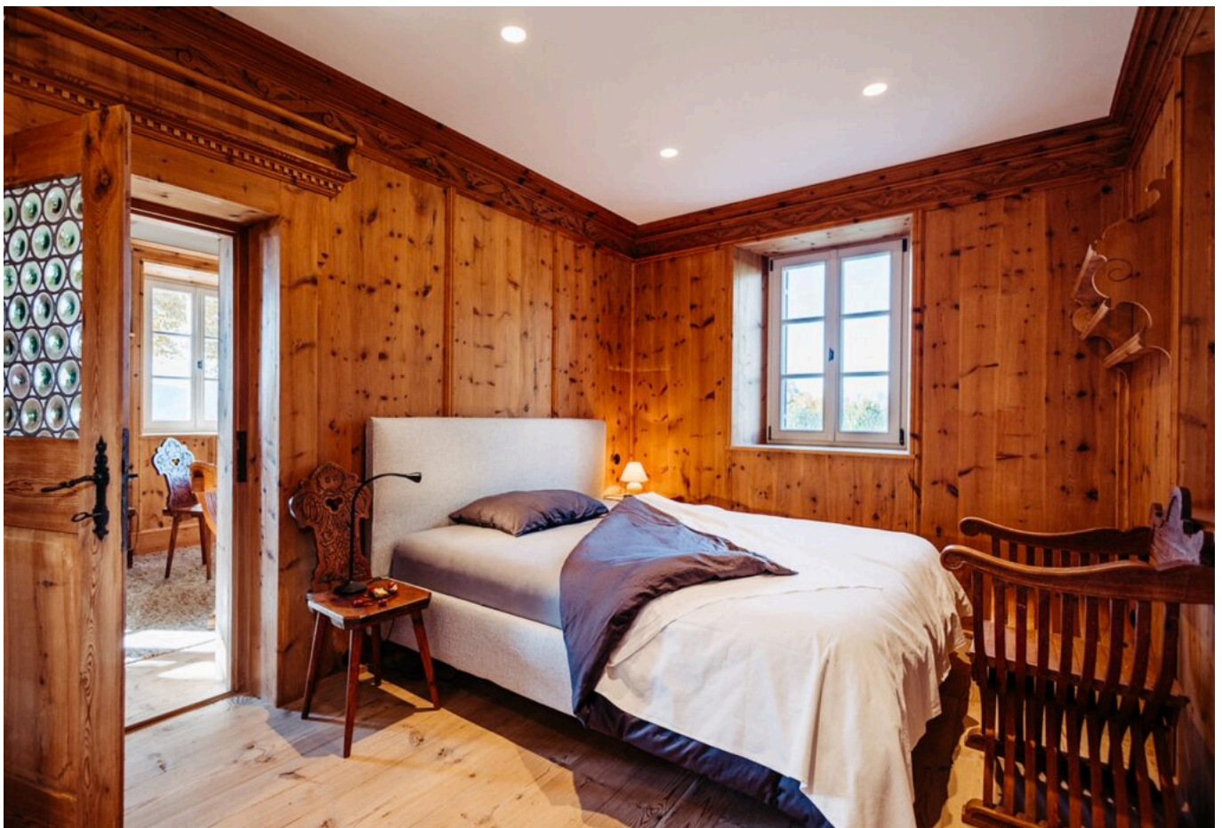
Abb. 6: Die hintere Stube heute; das Graffiti befindet sich hinter der Holztäfelung, rechts neben der Tür zur vorderen Stube, auf der Höhe der Bettoberkante.

Jedenfalls ist es ein interessantes Zeugnis der damals häufigen innertirolischen Arbeitsmigration. Dass ein deutschnationales Haus eine Welschtirolerin einstellte, die sich zudem auf Italienisch im Haus verewigt hat, ist einer der im praktischen Leben häufig anzutreffenden Widersprüche. Das Graffiti wurde im Zuge der Hausrestaurierung selbstverständlich nicht übermalt. Es harrt, wie schon zuvor 130 Jahren lang, seiner Wiederentdeckung hinter der neu montierten, alten Täfelung.