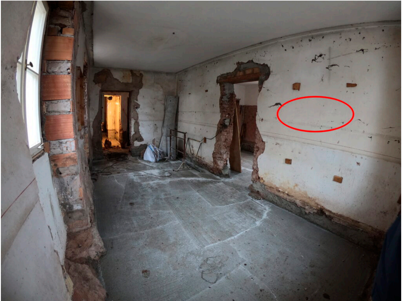
Abb. 2: Der Auffindungsort des Graffitis. Hinter der zeitweilig entfernten Täfelung der hinteren Stube kam es zutage, eingegrenzt auf dem Foto durch das farbige Oval.