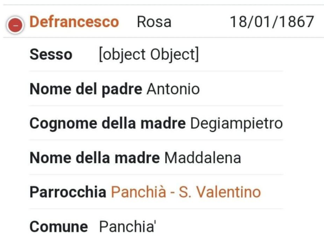
Abb 5: Auszug aus dem digitalen Kirchenbuch der Pfarre Panchià – San Valentino.

Die Entzifferung der Inschrift beruht auf den Bemühungen der Historikerin Daiana Boller, welche für mich auch in den digitalen Kirchenbüchern des Trentino nach der Person gesucht hat und dort auch fündig geworden ist (Abb. 5), ihr sei an dieser Stelle herzlich gedankt.