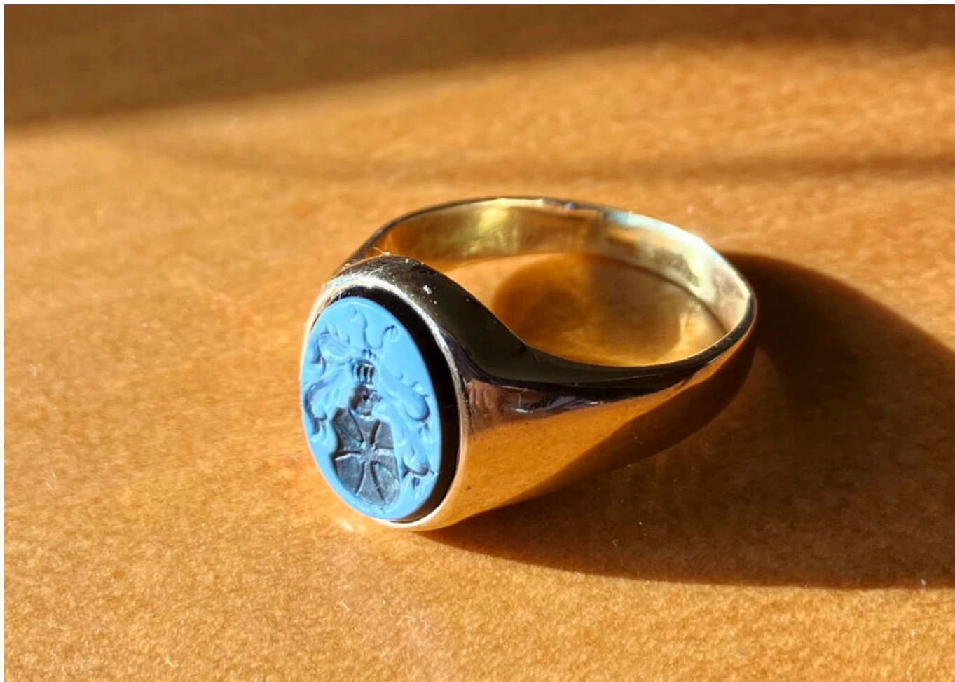
Abb. 4: ein sogenannter Siegelring.