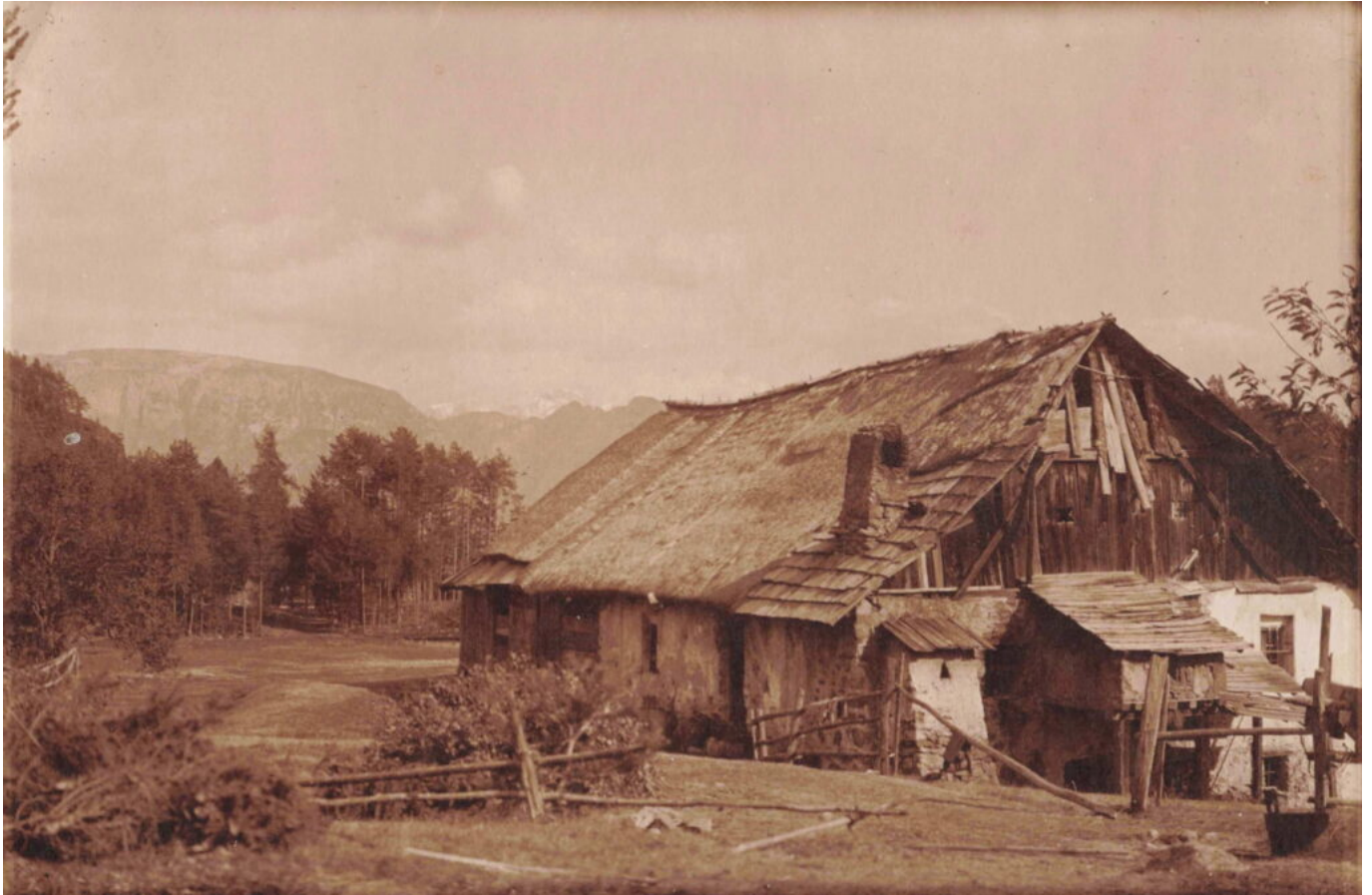
Abb. 3: Das alte, heruntergekommene Gebäude des Unterweihrerhofes, um 1910. Links kann man im Hintergrund den See mit einem sehr niederen Wasserstand erkennen.

aufgestellt waren, ein seltener Höhepunkt des Aufenthalts.