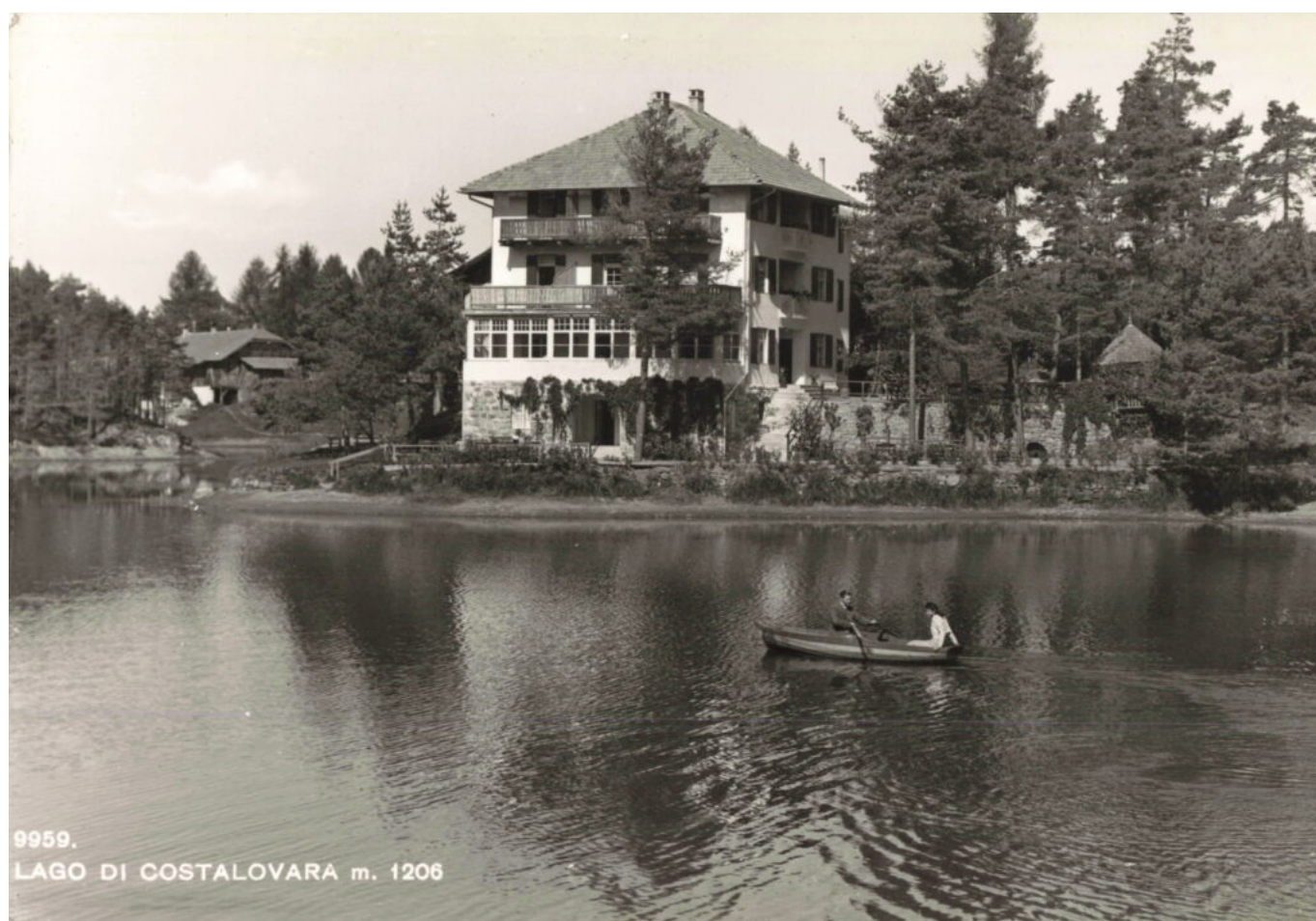
Abb. 16: „LAGO DI COSTALOVARA m. 1206“. Ansichtskarte aus den 50er Jahren. Das „Miralago“ mit dem neuen Dach. Im Hintergrund links ist der Unterweihrerhof ersichtlich.

Auf einer Ansichtskarte aus den Nachkriegsjahren (Abb. 15) erkennt man das Miralago , baulich aber stark verändert. Die vormals steil aufragende, das Gebäude stark charakterisierende Dachkonstruktion ist einem weitaus flacherem, schlichteren Walmdach gewichen. Was war der Grund für einen solcherartigen Eingriff? In den Dolomiten vom 5. August 1940 (Abb. 16) wird berichtet, dass ein Dachstuhlbrand das Haus größtenteils zerstört hat. Mitten in der Saison; trotzdem waren glücklicherweise keine Menschenleben zu beklagen. Bemerkenswert, dass laut Zeitungsbericht neben den freiwilligen Feuerwehren der Umgebung auch die Berufsfeuerwehr aus Bozen mit einer Sonderfahrt der Rittnerbahn auf dem Schauplatz angekommen ist. Dass es dafür ab der Alarmierung nur eine Stunde gebraucht hat, scheint mir aber eine propagandistische Übertreibung zu sein.