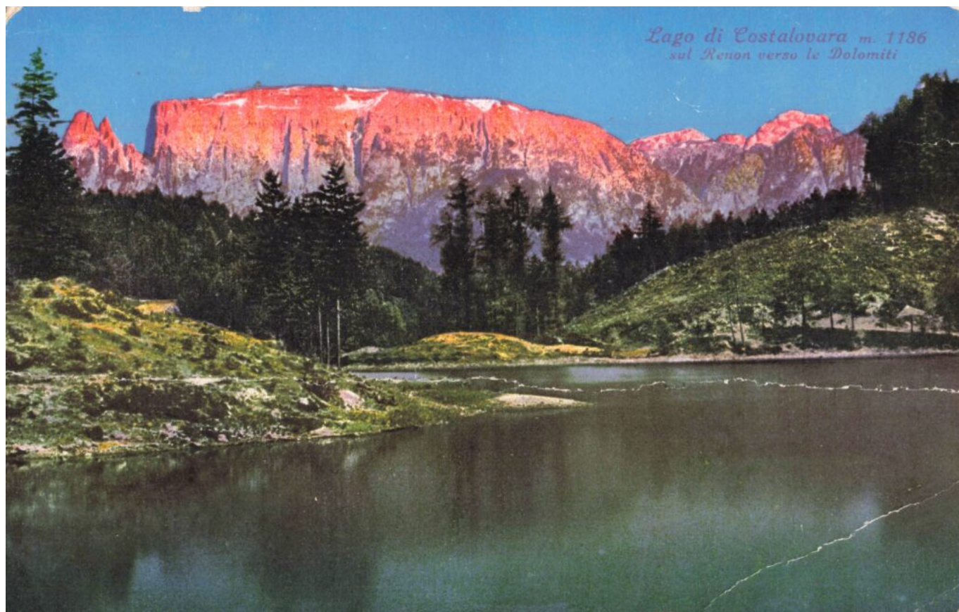
Abb. 1: „Lago di Costalovara m. 1186 sul Renon verso le Dolomiti „. Kolorierte Ansichtskarte, Anfang 20. Jh.

In der Auflistung der Seen auf der Webseite der Südtiroler Landesverwaltung wird das Gewässer folgendermaßen beschrieben: „Der Wolfsgrubener See befindet sich auf einer Meereshöhe von 1176 m und erstreckt sich über eine Fläche von 3,3 ha, seine maximale Tiefe beträgt 4 m. Der Badesee liegt am südöstlichen Rand der Rittner Hochfläche, die hier steil gegen den Bozner Talkessel abbricht. Der See ist natürlichen Ursprungs, er wurde durch Moränenschutt aufgestaut und mit einem künstlichen Damm ergänzt. Der Felsuntergrund besteht ausschließlich aus Quarzporphyr, der von Moränenschutt überlagert ist.