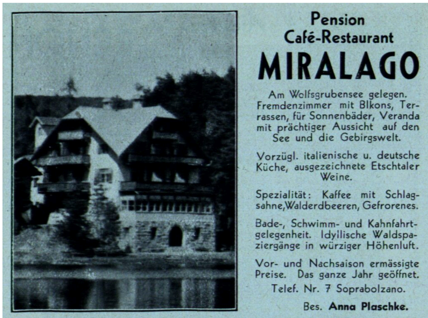
Abb. 8: Werbeinserat in „Renòn Kleiner Führer“ aus dem Jahre 1930. „... deutsche Küche, ...“: „Südtiroler Küche“ schreiben wäre verboten gewesen.

Abb. 7: Zeitungsausschnitt aus der „Alpenzeitung“ vom 2. Juli 1927. Man beachte die auferlegten rein italienischsprachigen Ortsbezeichnungen. Die ursprünglichen Bezeichnungen werden nur mehr als Erklärungen der neuen Toponomastik toleriert.