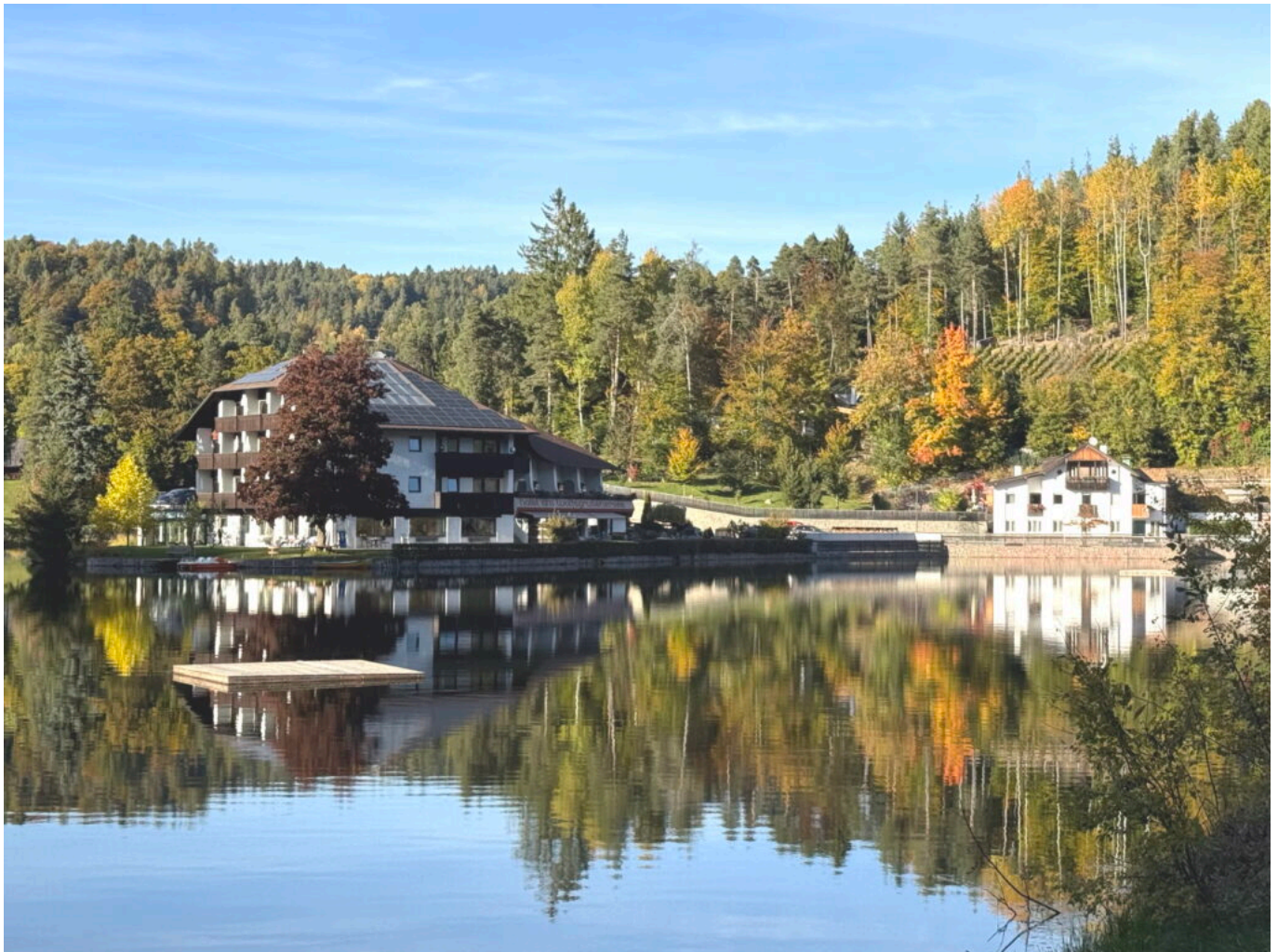
Abb. 18: Links das „Hotel am Wolfgrubener See“ und rechts das ehemalige „Gasthaus am See“ (2025).

am Wolfgrubenersee entsteht, das Gasthaus am See wird zu einem Haus mit Wohnungen umgebaut, das charakteristische hölzerne Bootshaus abgerissen (Abb. 18). Die Geschichte dieser Familie kann man sehr gut auf der Webseite des Hotels nachlesen. Gemäß dem Zeitgeist weicht die ehemals idyllisch bewaldete Halbinsel des Waldfrieden und Miralago einem Hotelbau mit ausgedehnten Wellnesseinrichtungen, Parkplätzen und anderen Infrastrukturen, welche für den gegenwärtigen Tourismus unabdingbar erscheinen.