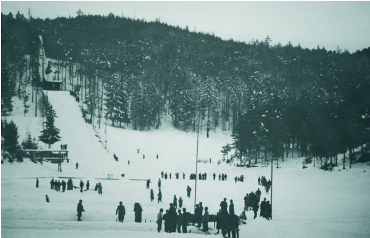
Abb 12: Die Skisprungschanze am dem Wolfgrubnersee.

Auslauf so wie die Zuschauerplätze auf dem zugefrorenen See. Die besten Springer erreichten Weiten von 50 m. Wettkämpfe der nordischer Kombination, auch wenn sie damals noch nicht so hießen, wurden dadurch auch ermöglicht.