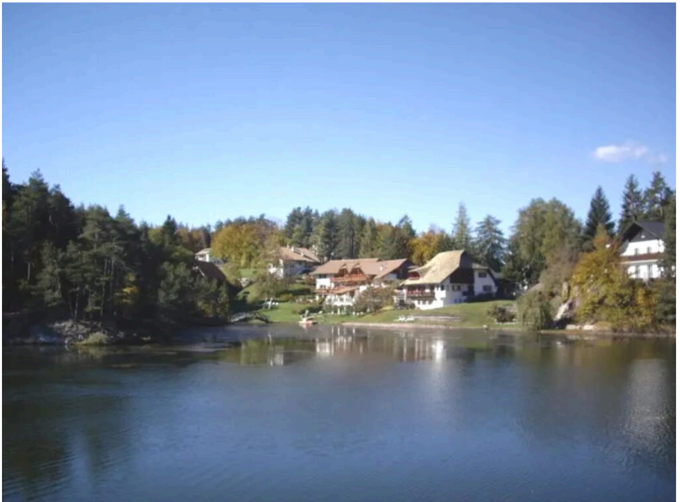
Abb. 17: Ab den 60er Jahren sind am Westende des Sees mehrere Gebäude entstanden, unter ihnen das Hotel Weiherhof, bestehend aus den beiden Gebäuden in der Mitte.

1960 errichten Cäcilia und Siegfried Pichler am Westufer des See, an der Stelle wo da Gebäude des Unterweihrerhofes stand, eine kleine Pension, den Weihrerhof . Über die Jahre wird sie immer wieder vergrößert – die inzwischen erfolgte Anbindung des Rittens durch eine komfortable Straßenverbindung hilft dem Auswertigen-Tourismus inzwischen enorm – um schlussendlich zu einem Hotel- mit deutlicher Spa-Ausrichtung zu werden (Abb. 17).