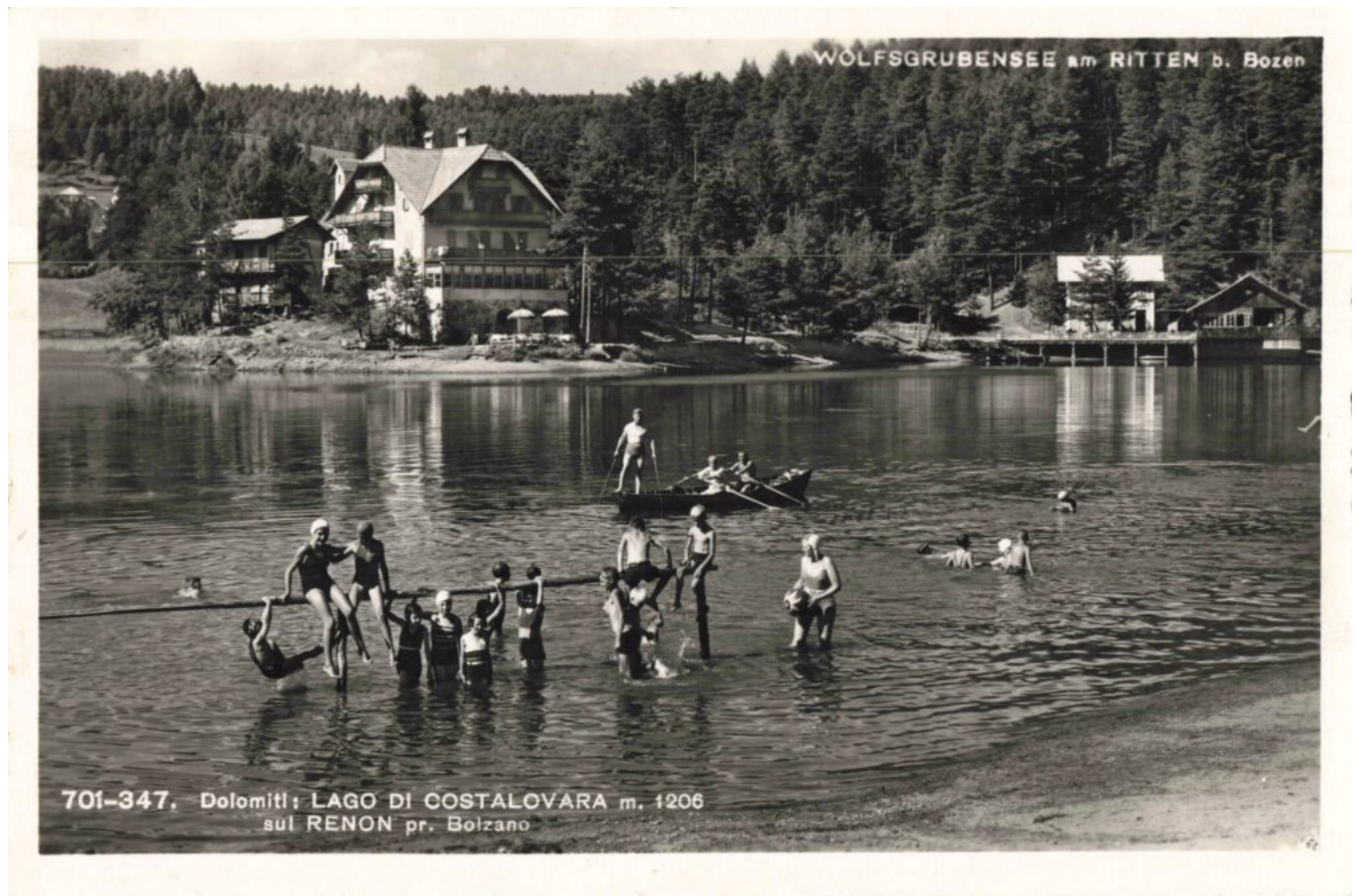
Abb. 9: „Dolomiti LAGO DI COSTALOVARA m. 1206 sul RENON pr. Bolzano WOLFSGRUBENSEE am RITTEN b. Bozen“. Ansichtskarte aus den 30er Jahren.

großzügiges Bootshaus aus Holz bekommen.