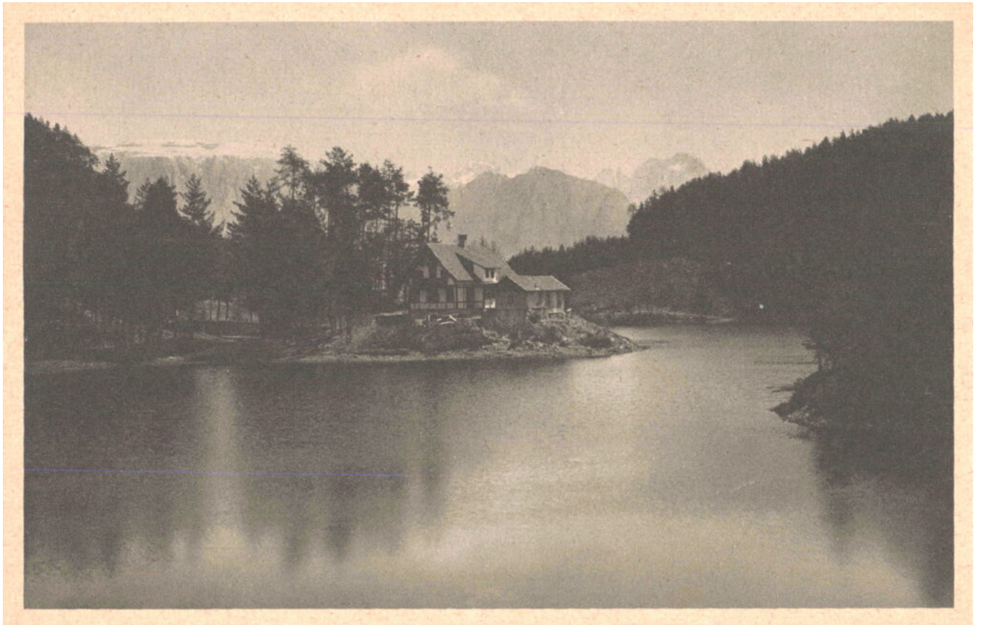
Abb. 4: „LAGO DI COSTALOVARA (M. 1206) SUL RENON PRESSO BOLZANO“. Ansichtskarte Anfang des 20. Jh., welche das „Cafe-Restaurant Waldfrieden“ in seinen ersten Bestandesjahren zeigt.