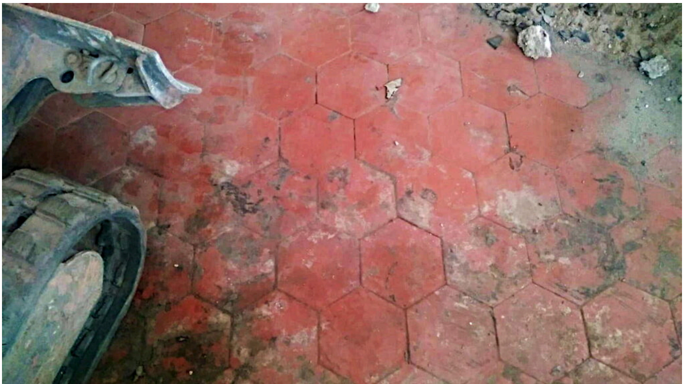
Der unerwartet vorgefundene alte Belag.