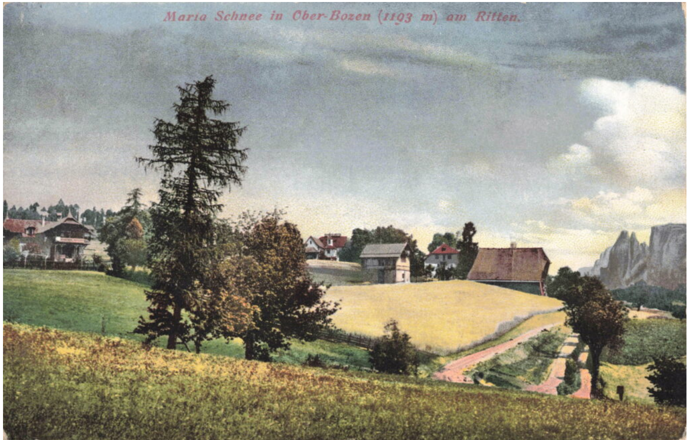
Abb. 1: „Maria Schnee in Ober-Bozen (1193 m) am Ritten“, kolorierte Ansichtskarte, Anfang 20. Jhdt.

Eine kolorierte Photographie aus den Jahren der vorletzten Jahrhundertwende. Der Photograph hat im Rücken die heutige Gelf-Villa und fotografiert Richtung Osten, ganz rechts im Vordergrund ist das Schlernmassiv zu sehen.