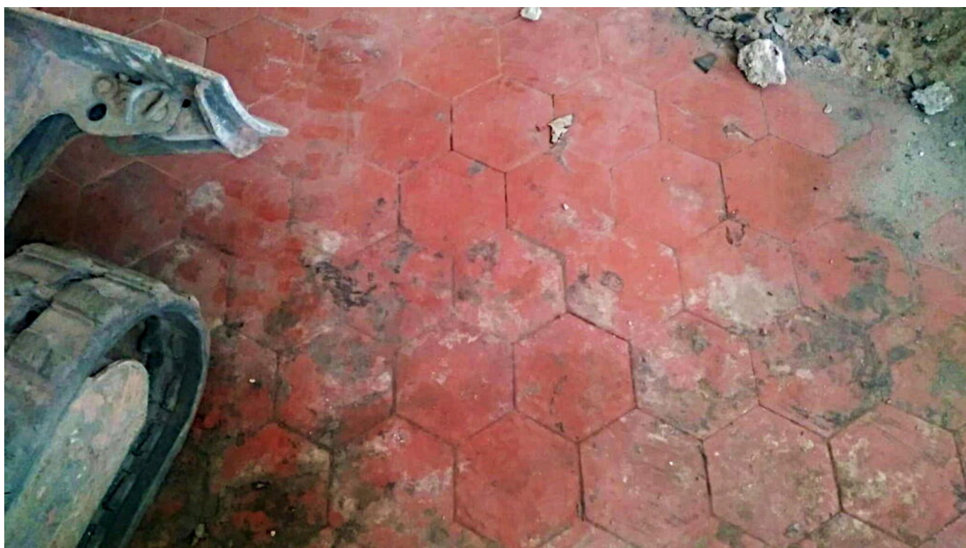
Der unerwartet vorgefundene alte Belag.