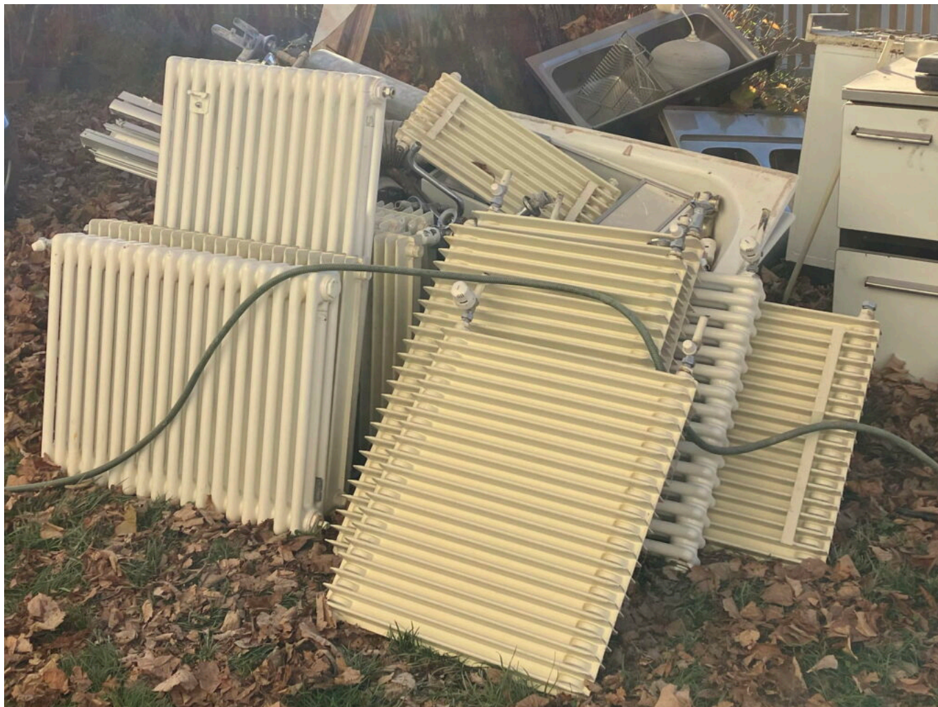
Abb. 5: Was anfangs der 70er noch ein gewichtiges Zeichen des technischen Fortschrittes war hat fünfzig Jahre später nur mehr Alteisenwert.

Die Anlage, errichtet noch vor der ersten Ölkrise, entsprach nach 50 Jahren bei Weitem nicht mehr den aktuellen Energiesparstandards, weswegen der erste Schritt der Anschluss an das Rittner Fernheizwerk im Jahr 2020 war. Die Verluste durch nicht isoliert verlegte Metallrohre in den Wänden und Fenstern, welche zwar noch sehr gut erhalten, aber trotzdem vom thermischen Standpunkt her überholt waren, verhinderten jedoch jede finanzielle Einsparung, insbesondere im Winterbetrieb. Deshalb ist ein zentraler Teil der momentanen Umbauarbeiten die komplette Umstellung der Heizung auf Fernwärme mit Fußbodenheizung, sowie das Ersetzen der Fenster.