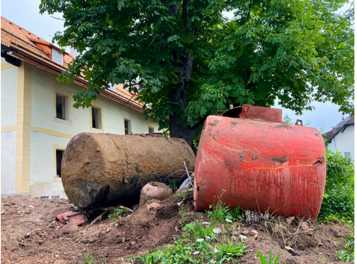
Abb. 1: Links der öltäre, aus Stahl, rechts der neuere, aus Kunststoff bestehende Heizöltank nach dem Ausgraben.

Category: Menschen, Oberbozner Sommerfrische, Renovierung geschrieben von Armin Kobler | 29. Juli 2023