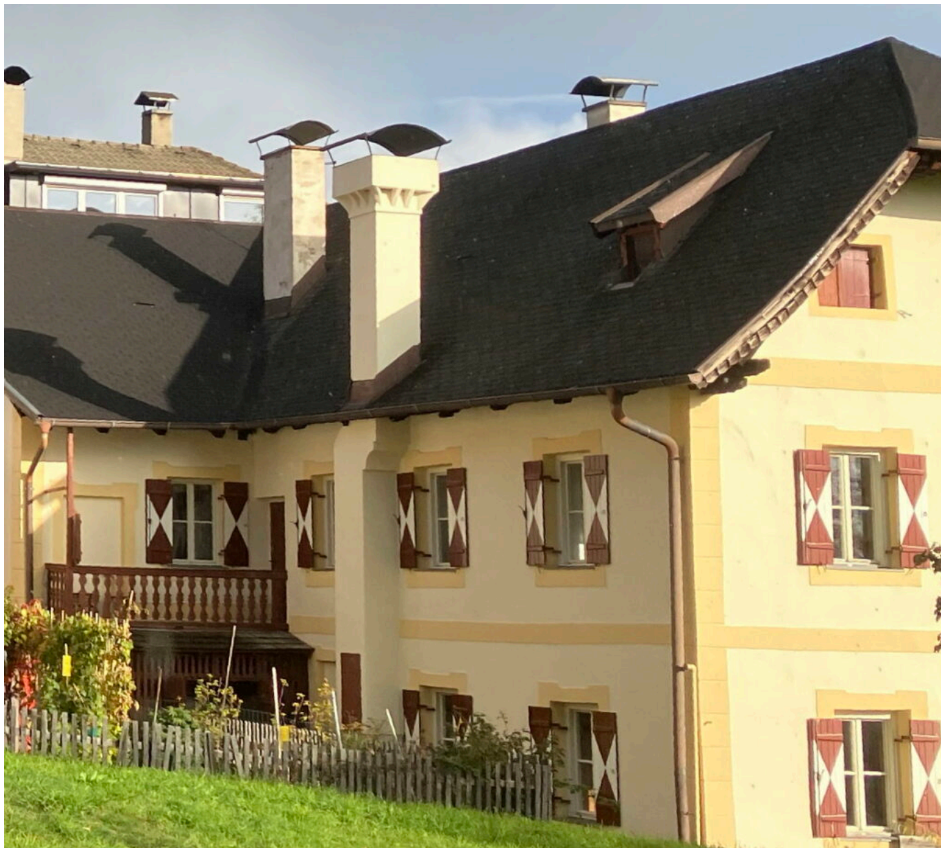
Abb. 4: Gut sichtbar der um 1900 nachträglich angebrachte Außenkamin.

Komplett winterfest im heutigen Sinne wurde das Haus durch die Umbauarbeiten, welche meine Eltern im Winter 70 und Frühjahr 71 durchführen ließen. In beiden Wohnungen wurden sogenannte Wagner-Fenster eingesetzt und eine ölbefeuerte Zentralheizung installiert, welche alle anderen Heizungsgerätschaften ersetzte. Dazu wurden unter fast allen Fenstern in aufwendig herausgebrochenen Nischen Heizkörper montiert. Der erste, größere Öltank fand unter der Erde an der Westseite seinen Platz, der den später verschärften Normen entsprechende neue gleich darüber in der Wiese. Der Kachelofen in der hinteren Stube des Erdgeschosses wurde abgerissen um einer Verbindungstüre Platz zu machen, dafür wurde in der vorderen ein neuer aufgebaut. In der Küche wurde dem Gasherd ein mit Holz befeuerter beige gestellt.