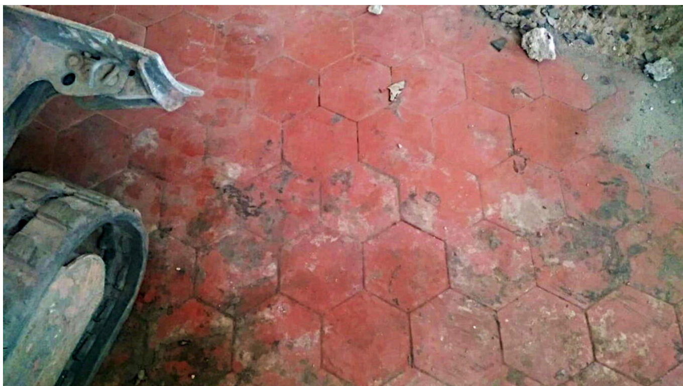
Der unerwartet vorgefundene alte Belag.