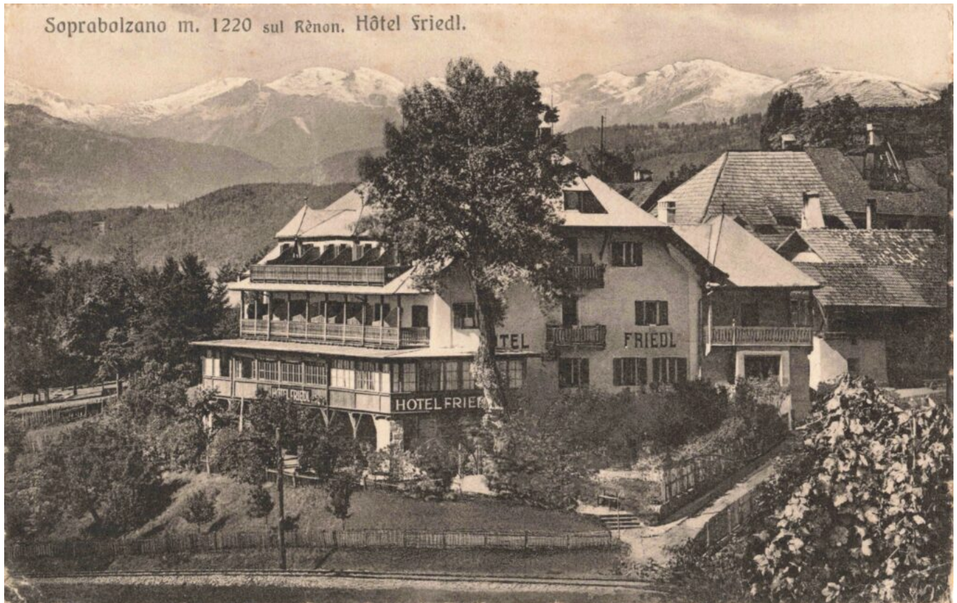
Abb. 4: Vom Gasthof Hofer (siehe Abb. 5 im vorigen Beitrag) zum Hotel Friedl. Jetzt ist vom vorigen Bauernhof kaum mehr was zu erkennen, eine großzügige Veranda und viele Balkone prägen die Südseite, im Norden ist ein turmartiger Zubau entstanden, die spätere Dependence rechts ist aber noch Wirtschaftsgebäude. Auf Grund der ausschließlich italienischsprachigen Beschriftung ist die Ansichtskarte der Zwischenkriegszeit zuzuordnen.

Um dem wachsenden Maria Schnee auch eine dörfliche Struktur zu geben, wurden in der Nähe der Kirche zwei Wohnhäuser mit Geschäftslokalen im Erdgeschoss errichtet, welche aneinandergebaut waren und somit den Beginn eines sich weiterzuentwickelnden Straßenzuges ergaben. Heute ist darin das „Tutti Patschengele“ und der „Weissensteiner“ untergracht. Dafür musste aber der Stadel des Oberhofers mit seinen Nebengebäuden weichen.