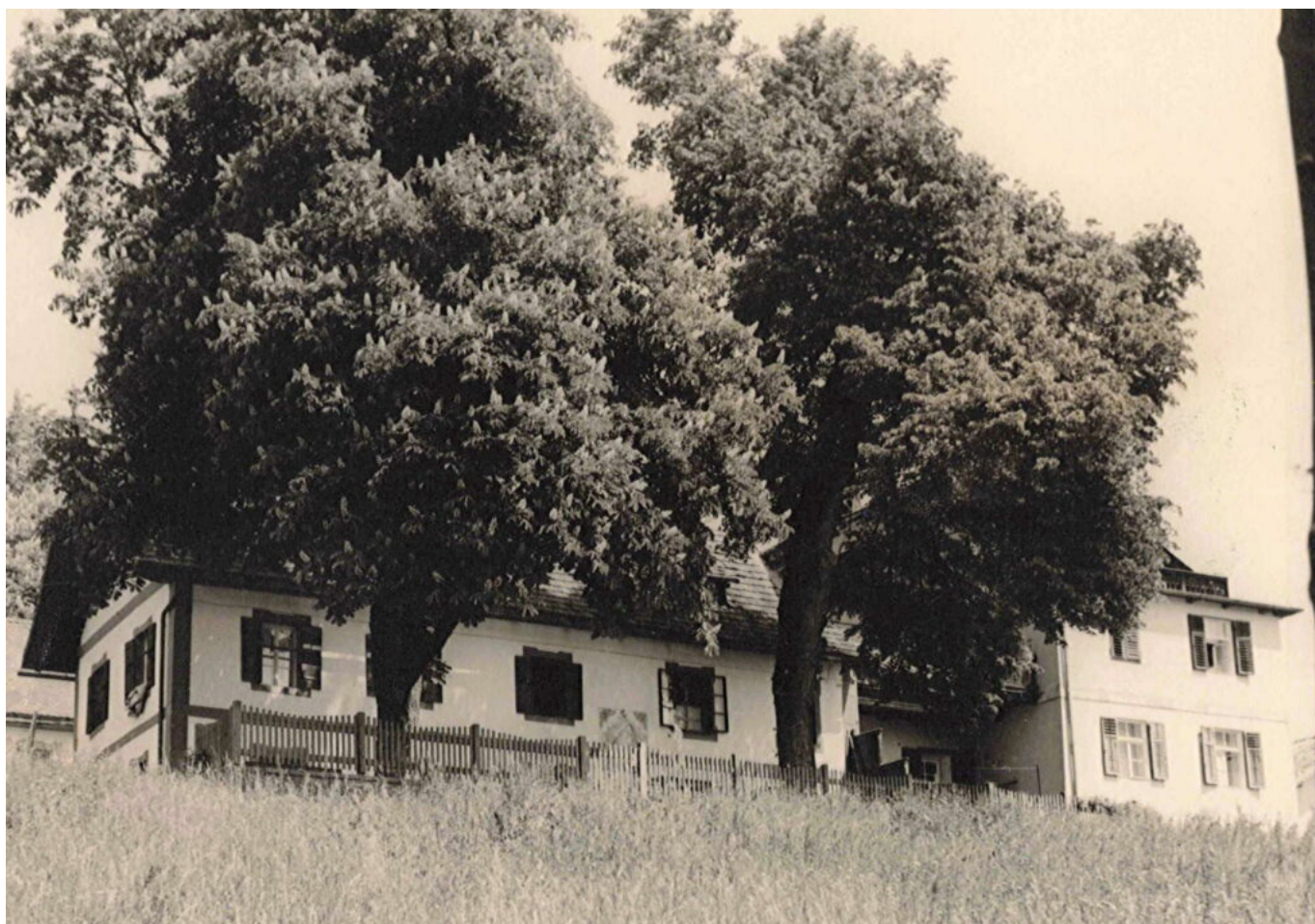
Abb. 7: Villa Kinsele (links) und Villa Barbara (auf dem Foto leider teilweise von unserer Linde verdeckt) von Süden in den 50er Jahren. Nichts erinnert mehr an das frühere Oberhoferhaus.

erweitert, beherbergte neben einer kleinen Wohnung im Erdgeschoss zeitweise die erste Filiale der örtlichen Raiffeisenkasse.