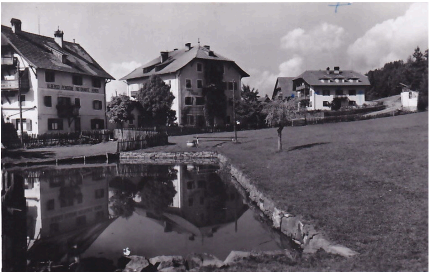
Abb. 6: Ganz rechts der in den 30er Jahren neu erbaute Hofer, das Bild dürfte vor dem Zweiten Weltkrieg entstanden sein. Zu sehen ist noch der erste Stadel, der 1966 ein Raub der Flammen wurde.