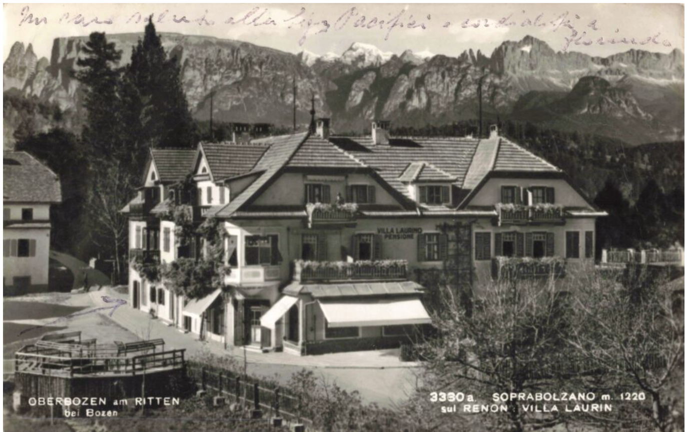
Abb. 10: Das im Zuge der baulichen Entwicklung in Maria Schnee entstandene kleine Handelszentrum: die ehemals als Metzgerei, Gemischtwarenhandlung und Pension genutzten Gebäude Baumgartner-Prock. Vorne links der erste, noch nicht überdachte Musikpavillon mit den fixen Notenpulten, welcher dort errichtet wurde, wo früher der Unterhoferstadel nordseits an den Weg grenzte (Ansichtskarte, vermutlich 1950er Jahre. Auch dieses Mal ein krasser Vedutenschwindel, die im Hintergrund dargestellten Dolomiten liegen tatsächlich im Rücken des Betrachters).

Von nun an erinnerte im Zentrum von Maria Schnee nichts mehr an die vergangene bäuerliche Tätigkeit, der Wandel von ausschließlich landwirtschaftlich genutzten Gebäuden zu Handel, Dienstleistung und Tourismus war vollzogen.