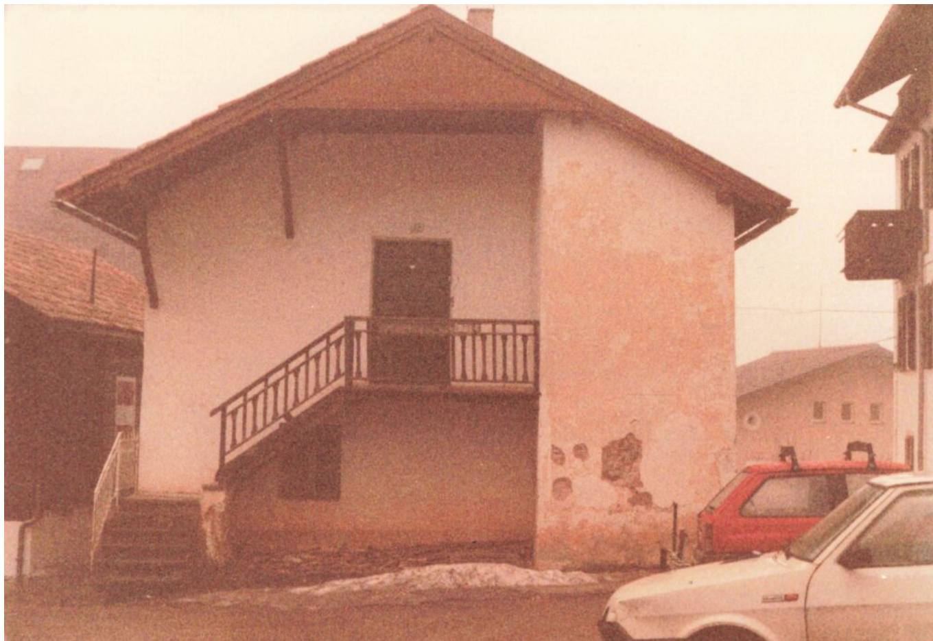
Abb. 9: Nordseite des Nebengebäudes des ehemaligen Oberhofers, Anfang der 80er Jahre. Der schwer zu findende Eingang zur ebenerdigen Raiffeisenkasse befand sich auf der Ostseite, man musste links durch den schmalen Durchgang zwischen dem Gebäude und der Dependance des Hotels Post gehen. Die Wohnung im ersten Stock wurde vermietet.

Der große Unterhoferstadel brannte 1902 und 1913 durch Blitzschlag ab, wurde aber jedes Mal wieder aufgebaut. Schließlich fiel er nach der Aussiedlung des Hofers der Spitzhacke zum Opfer. An seiner ehemaligen Nordseite stand dann jahrzehntelang der hölzerne Pavillon der Musikkapelle Oberbozen, zuerst ohne, dann mit teilweiser Überdachung. Auch der neue Hoferstadel brannte übrigens schon einmal ab, und zwar 1966, wobei die Brandursache laut Zeitungsbericht diesmal nicht festgestellt werden konnte.