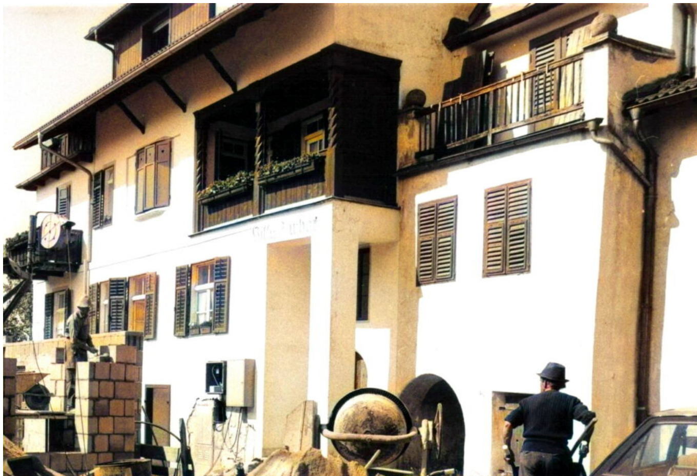
Abb. 8: Die Ostseite der Villa Barbara – die Inschrift unter der Loggia ist noch erkennbar – und rechts ein Teil des Wegerhauses, 1985. Das Nebengebäude (Abb. 9) ist bereits abgerissen, das Gasthaus Babsi entsteht.