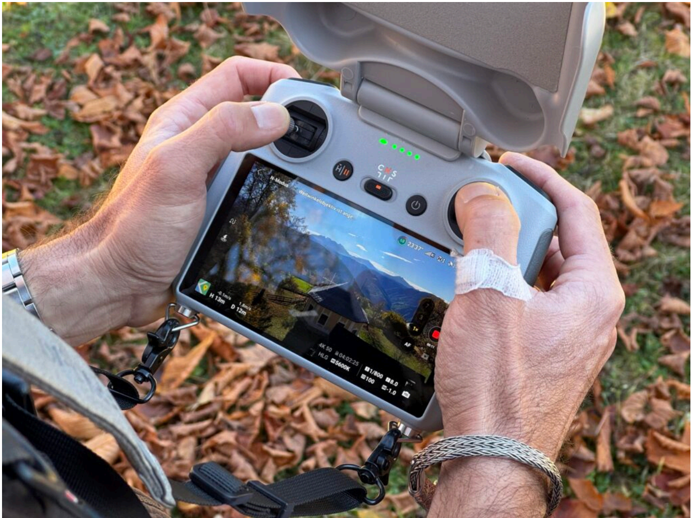
Abb. 6: Das Ergebnis der Aufnahmen ist sogleich ersichtlich.