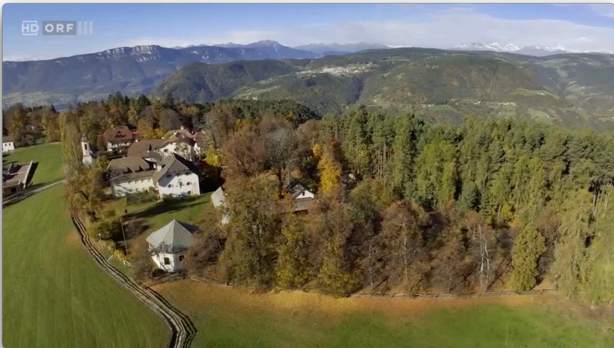
Abb. 3: Der Oberbozner Schießstand aus der Vogelschau. Bildschirmfoto aus dem Film.

Holzner und Klaus Demar. Aus dem Begleittext: „Die Doku erzählt von den Anfängen des heimischen Tourismus und von Persönlichkeiten, die ihn prägten – etwa Olga Schneider, eine charismatische Wirtin des Reichenauer Thalhofes, deren Esprit Gäste wie Arthur Schnitzler anzog. Die Produktion zeigt Orte und Pioniere, an denen erste Hotels entstanden. Trotz einfachem Komfort setzte man auf Service. Ein Höhepunkt war das erste Berghotel der Monarchie auf dem Schafberg, erreichbar per Zahnradbahn.“