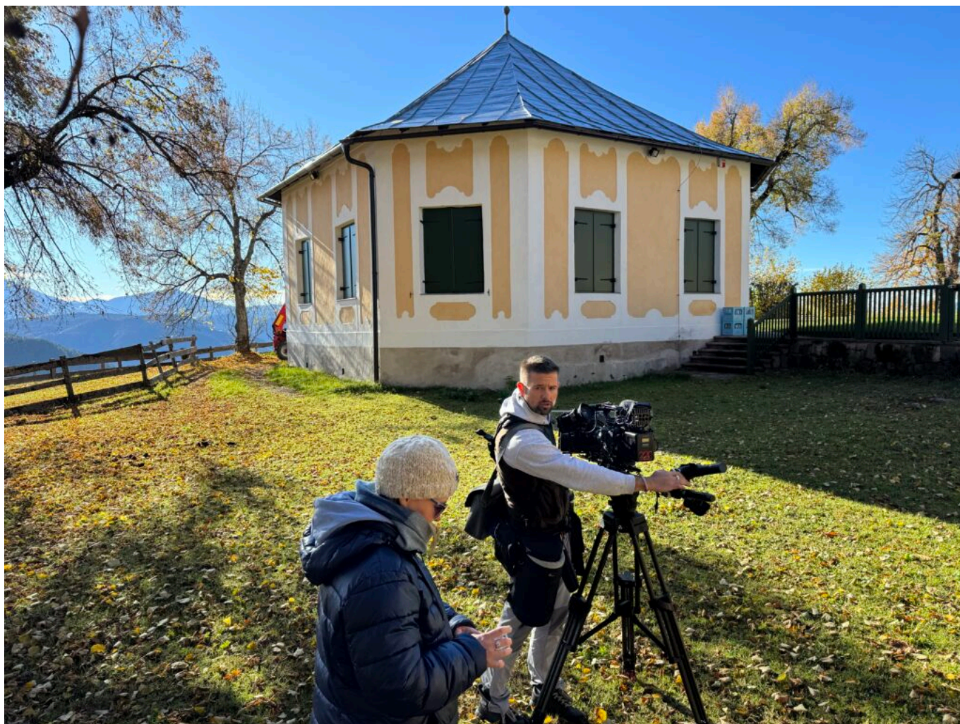
Abb. 7: Vor dem „Neuen Schießstand“ der Oberbozner Schützengesellschaft in Maria Himmelfahrt/Oberbozen.