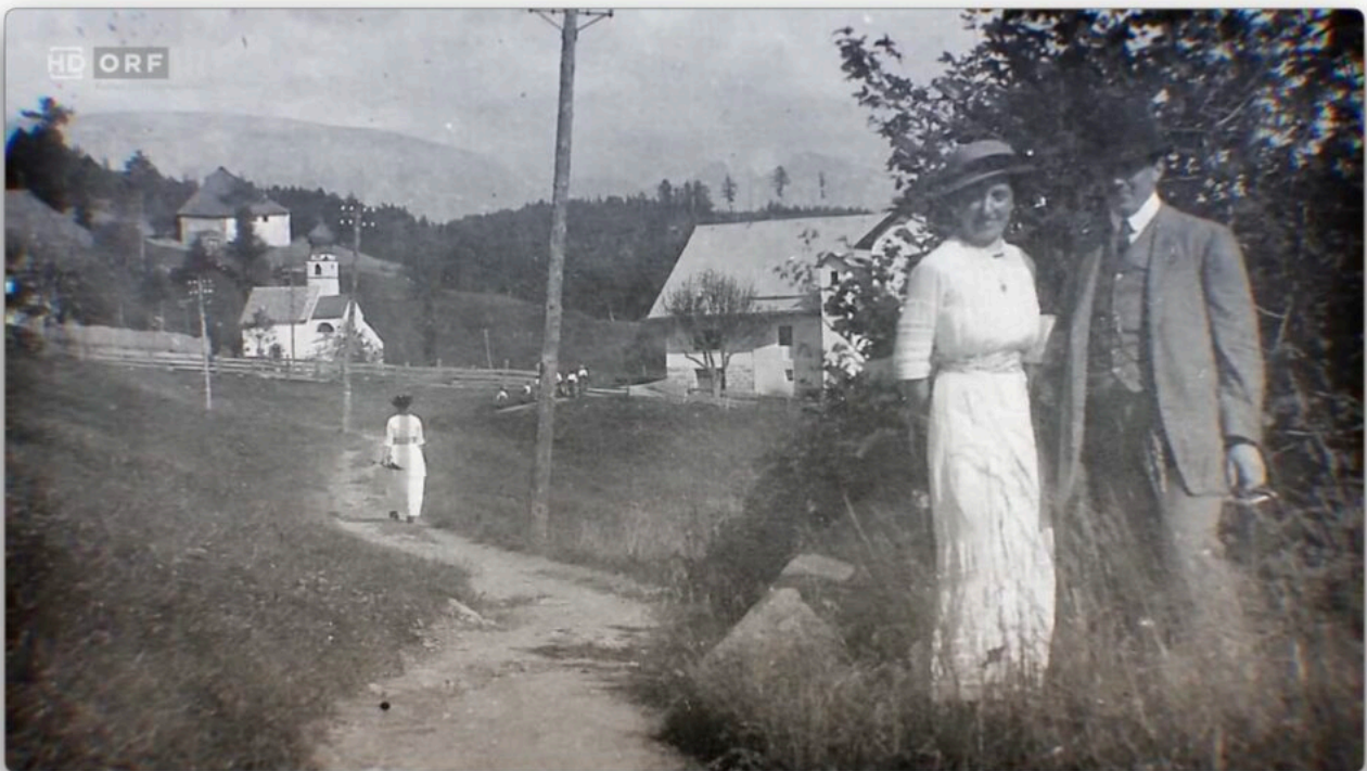
Abb 1. Sommerfrischgesellschaft auf dem Weg nach Wolfsgruben. Bildschirmfoto aus dem Film.

Die Zeit der Sommerfrische beginnt, am Ritten traditionell zu Peter und Paul (29. Juni). Als Einstimmung dafür eine bemerkenswerte Filmdokumentation von Birgit Mosser. Mich hat es sehr gefreut, mit Informationen, Kontaktevermittlung, Begleitung vor Ort und mit eigenen Texten bei der Realisierung im Herbst 2025 mithelfen durfte.