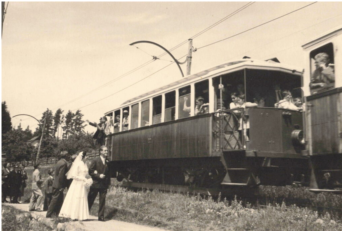
Abb. 1: 22. Juli 1956. Meine Eltern wurden gerade in der Kirche Maria Himmelfahrt getraut und begeben sich mit den Hochzeitsgästen zu Fuß in das Hotel Holzner. Kurz vor dem Doppelbauer (Hotel Viktoria) werden sie von einem Richtung Klobenstein fahrenden Zug überholt. Von den gezogenen Beiwägen mit ihren kennzeichnenden offenen Plattformen ist leider kein einziger übrig geblieben.

Dass diese Wahrnehmung zu einem guten Teil einer verklärten Erinnerung geschuldet ist, sei an dieser Stelle auch angemerkt: Jeder, der nicht als Tourist unterwegs ist, weiß es heute nämlich zu schätzen, dass gegenüber den früheren neun täglichen Fahrten zu je 55 Minuten das Rittner Hochplateau heute im 4-Minuten-Rhythmus nach nur 12 Minuten Fahrzeit erklommen wird.