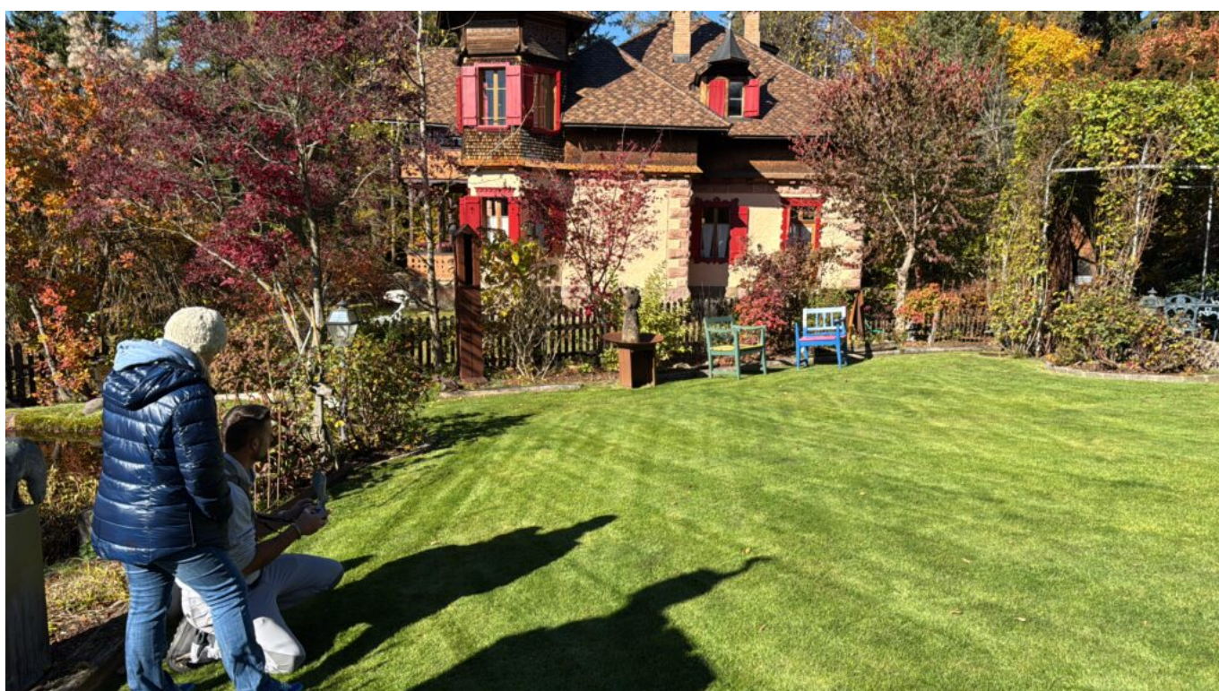
Abb. 8: Im Garten der Villa Anna in Maria Schnee/Oberbozen, Zeugnis