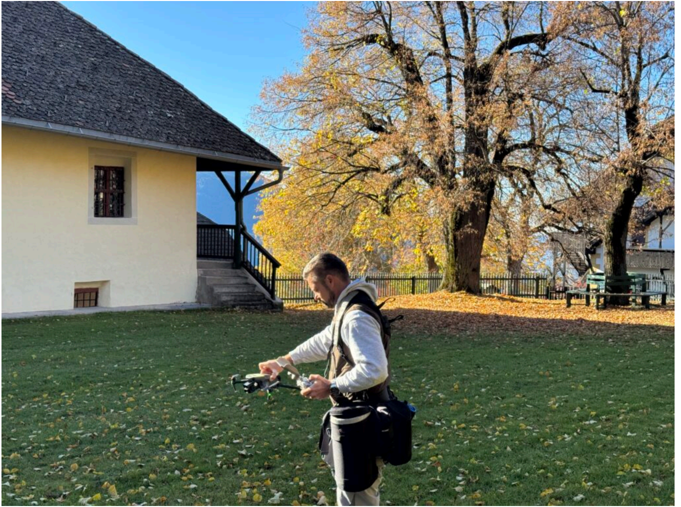
Abb. 5: Eine Drohne sorgte für die spektakulären Landschaftsaufnahmen.