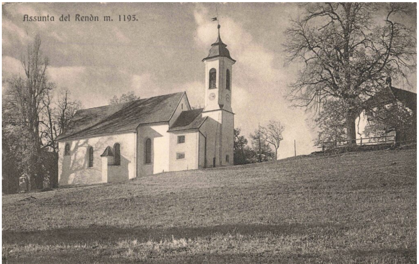
Abb 1: „Assunta del Rendn m. 1193“ (Ansichtskarte, Zwischenkriegszeit).

Der Fotograf steht in der Nähe des Friedhofsingangs und fotografiert nach Nordwesten. Das Hauptmotiv ist die Kirche Maria Himmelfahrt in Oberbozen. Rechts ist noch ein Teil des Frühmesserhauses zu sehen. Sie wurde 1669 erbaut, 1791 erweitert und ist die Nachfolgekirche der weiter entfernten, auf einem markanten Hügel befindlichen Kirche St. Georg und Jakob. Maria Einsiedeln, St. Magdalena und auch Maria Schnee, letztere bis 1866 sind bzw. waren hingegen private Gotteshäuser.