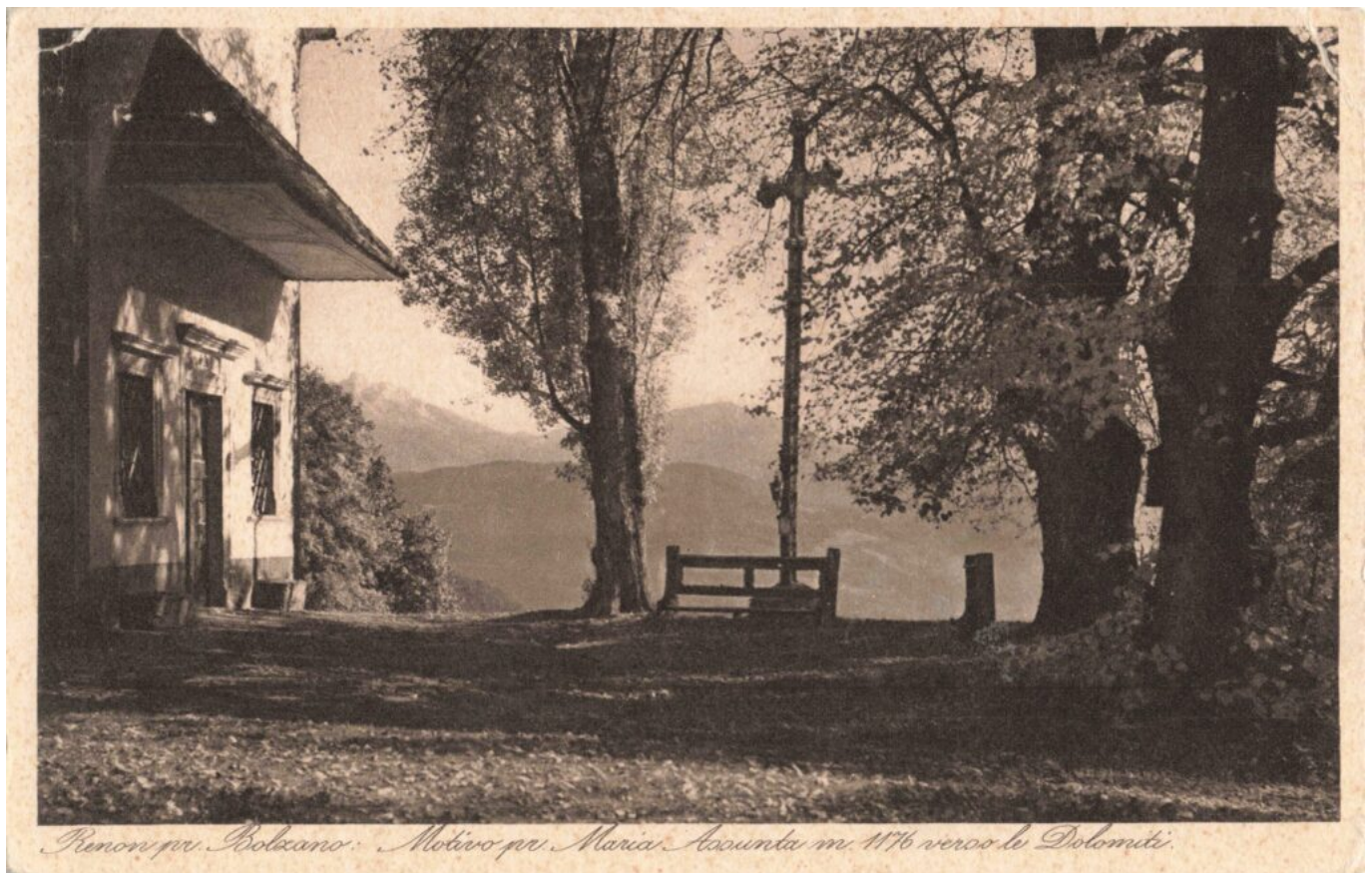
Abb. 3: Einer der stimmigsten Orte in Oberbozen: „Renon pr. Bolzano Motivo pr. Maria Assunta m 1176 verso le Dolomiti“ (Ansichtskarte, Zwischenkriegszeit).

Details über diese schöne Barockkirche mitten in der Oberbozner Sommerfrischsiedlung kann man im 2000 erschienenen Kirchenführer Die Kirchen von Oberbozen nachlesen. Interessantes Detail am Rande: Die Kirche in Bozen Stadt ist auch der Himmelfahrt Marias geweiht, welche bekannterweise im Hochsommer, am 15. August begangen wird. Haben die Sommerfrischler das deshalb gemacht, damit sie nicht für diese Tage ihr Hitzerefugium verlassen mussten? Auch das Kirchlein in Herrenkohlern, einer kleineren Sommerfrischsiedlung am gegenüber liegenden Kohlererberg hat übrigens am gleichen Tag Patrozinium. Ein Schelm, wer Böses dabei denkt?