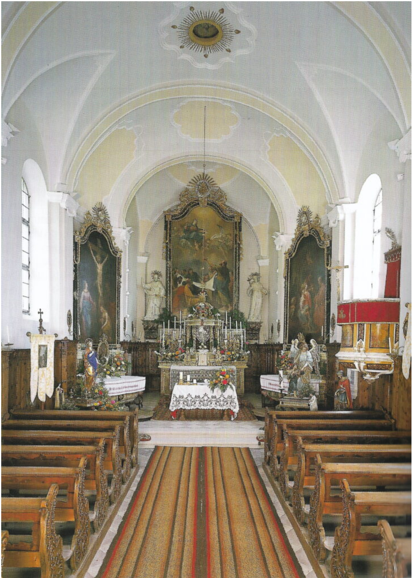
Abb. 2: Innenansicht (Foto aus „Die Kirchen von Oberbozen“, 2000)