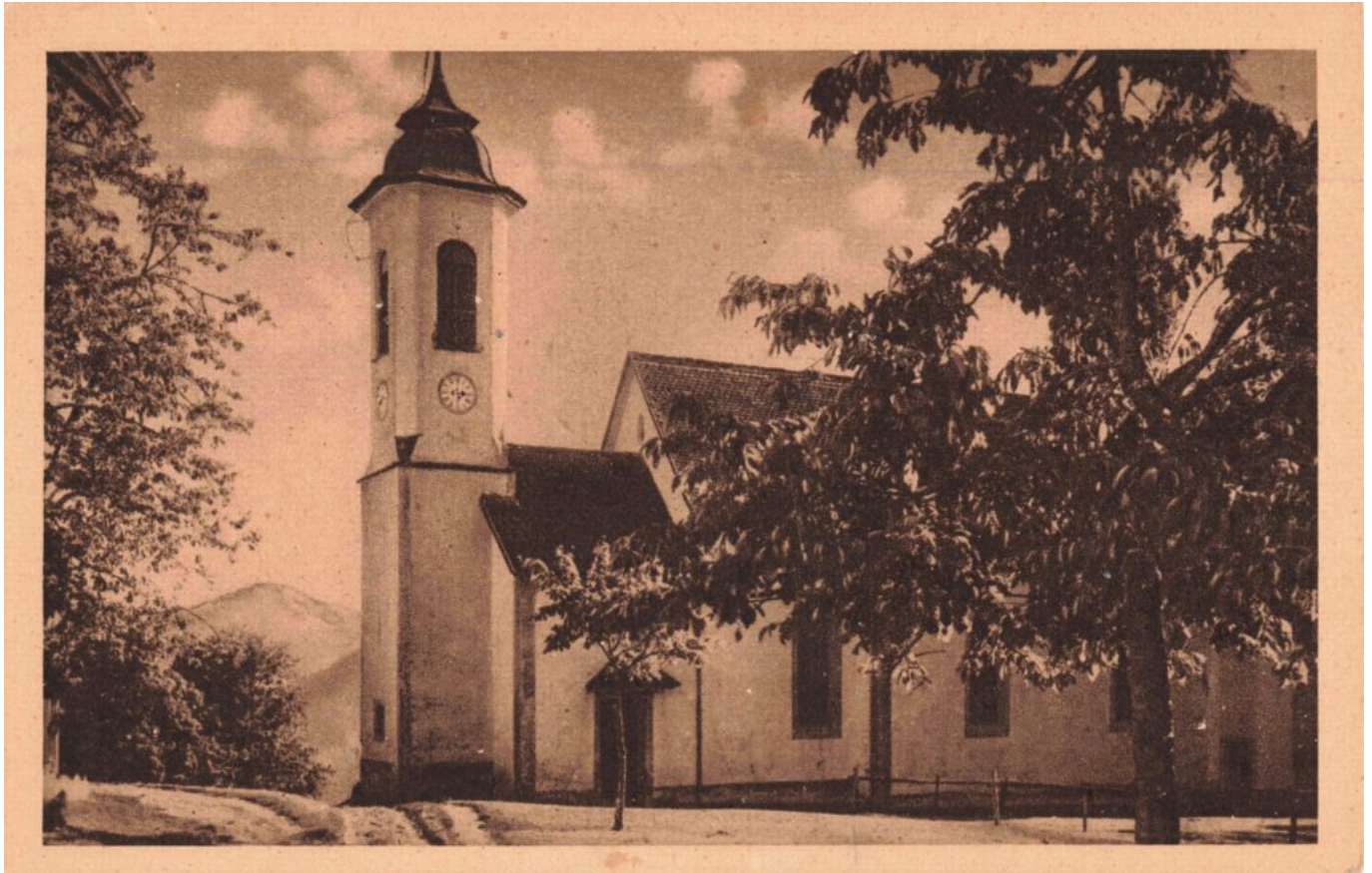
Abb. 4: „Chiesa – Assunta. Soprabolzano sul Renon“ (Ansichtskarte, Zwischenkriegszeit).

In diesem Beitrag verwendete Literatur- und Bildquellen: