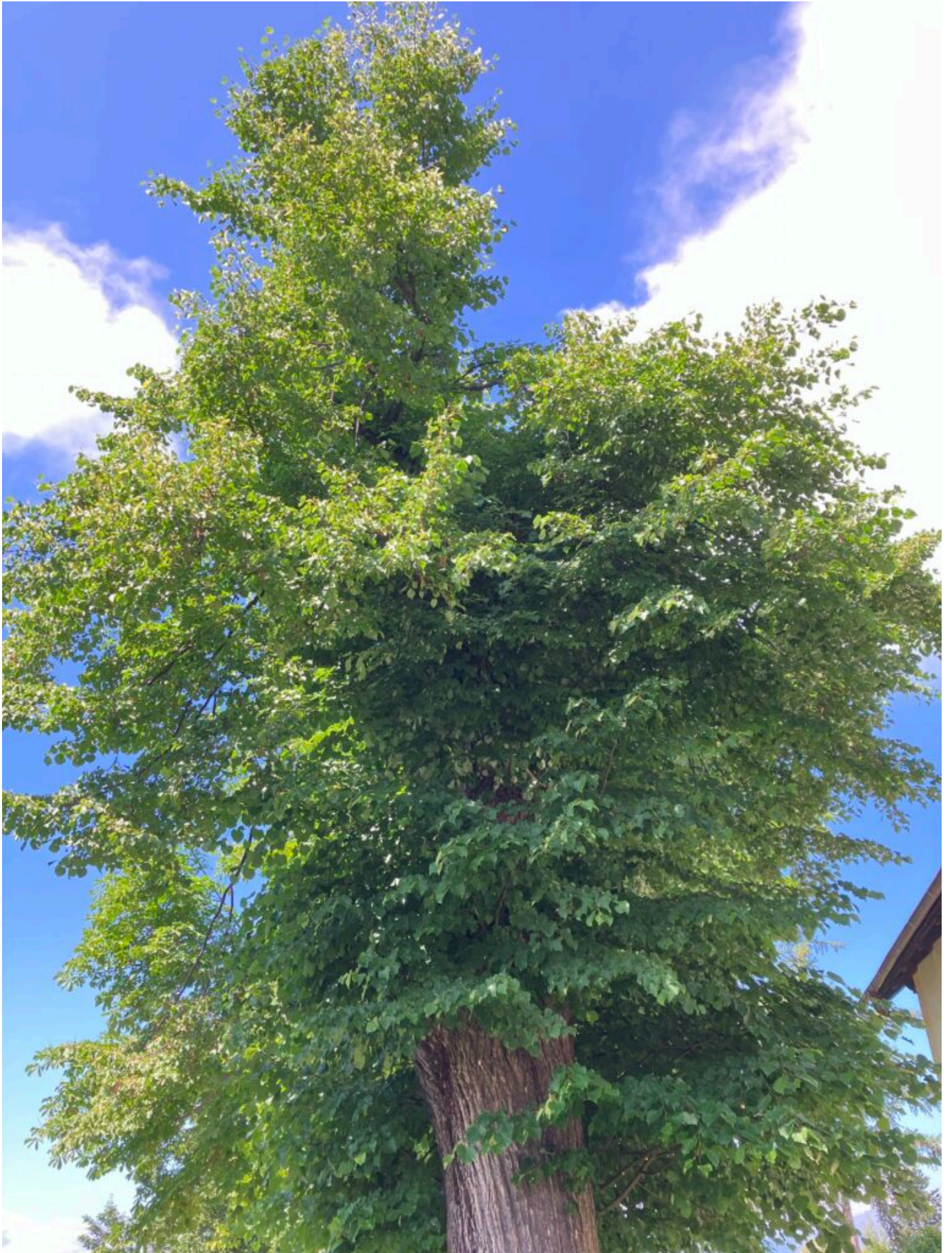
Die sanierte Linde an der Südseite.

Die Rosskastanie im Westen ist zum letzten Mal auf einem Aquarell von