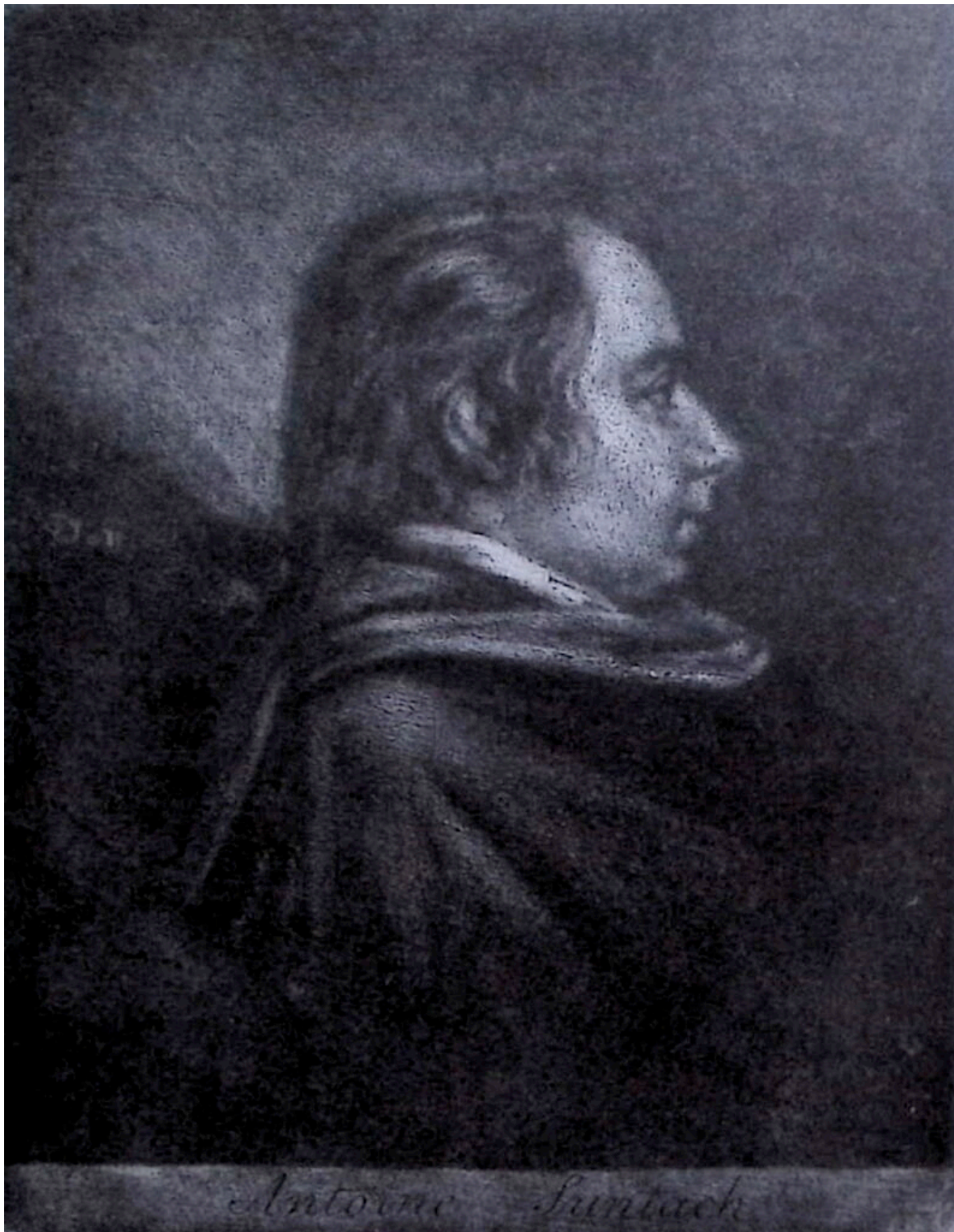
Abb. 3: Antonio Suntach (Venedig 1744, Bassano del Grappa 1828).

© MBA Musei Biblioteca Archivio Bassano del Grappa. Jede Vervielfältigung, Verbreitung oder Veröffentlichung bedarf der Erlaubnis des Rechteinhabers.