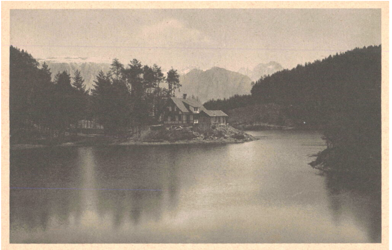
Abb. 4: „LAGO DI COSTALOVARA (M. 1206) SUL RENON PRESSO BOLZANO“. Ansichtskarte Anfang des 20. Jh., welche das „Cafe-Restaurant Waldfrieden“ in seinen ersten Bestandesjahren zeigt.