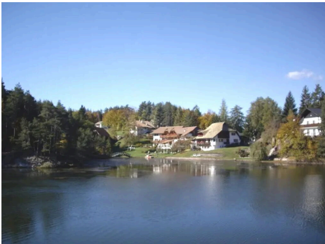
Abb. 17: Ab den 60er Jahren sind am Westende des Sees mehrere Gebäude entstanden, unter ihnen das Hotel Weiherhof, bestehend aus den beiden Gebäuden in der Mitte (Foto: Landesagentur für Umwelt und Klimaschutz).

1960 errichten Cäcilia und Siegfried Pichler am Westufer des See, an der Stelle wo da Gebäude des Unterweihrerhofes stand, eine kleine Pension, den Weihrerhof . Über die Jahre wird sie immer wieder vergrößert – die inzwischen erfolgte Anbindung des Rittens durch eine komfortable Straßenverbindung hilft dem Auswertigen-Tourismus inzwischen enorm – um schlussendlich zu einem Hotel- mit deutlicher Spa-Ausrichtung zu werden (Abb. 17).