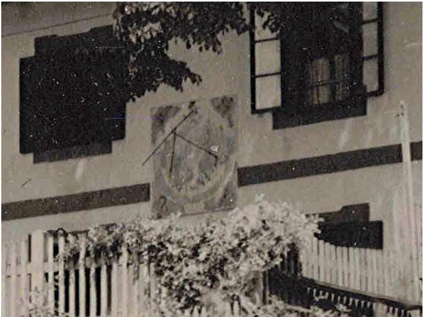
Vergrößerter Ausschnitt aus einem Foto um 1960.

wahrscheinlich von Sonne und Wetter schon etwas gebleicht. Interessant, so nebenbei bemerkt, wenn man die Fotos 1 und 3 betrachtet, die Jalousien bzw. Winterfenster, welche in der alten Stube im ersten Stock und nur dort, die Terlen, d.h. die einfachen Fensterläden, ersetzt haben. War das eine Art Probelauf für das ganze Haus oder sollten in diesem Raum spezielle Lichtverhältnisse geschaffen werden?