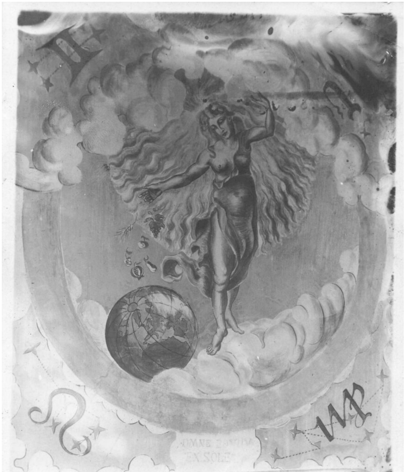
Mittlerer Teil der Sonnenuhr, geschätzt um 1910.

Auf dem Foto unten, das um 1960 entstanden ist, kann man keine Details auch bei starker Vergrößerung erkennen, die Farben erscheinen aber im Vergleich zur ersten Aufnahme etwas weniger stark,