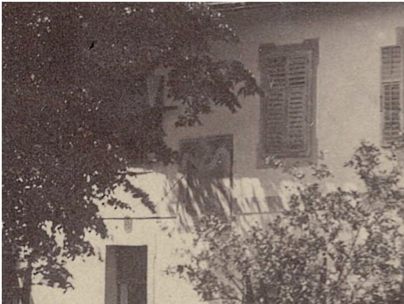
Vergrößerter Ausschnitt aus einem Foto um 1890.

Doch was ist von dieser Sonnenuhr geblieben? Leider nur mehr ein paar unvollständige bzw. unscharfe Fotos. Um 1890 dürfte sie noch in gutem Zustand gewesen sein, siehe Foto oben. Als etwas später kann man das zweite hier dargestellte Bild datieren, es stellt den mittleren Teil der Sonnenuhr dar, sie scheint noch gut erhalten gewesen zu sein. Es zeigt die Sonne als Frau mit Strahlenkranz, welche der Erde Früchte schenkt. An den vier Ecken sind Sternbilder sichtbar. Die Schrift am unteren Ende – Omne Bonum Ex Sole – bedeutet auf deutsch so viel wie „Alles Gute kommt von der Sonne“.