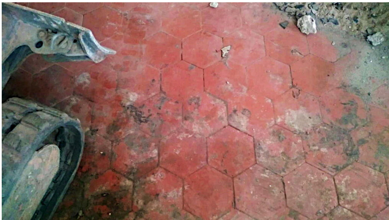
Der unerwartet vorgefundene alte Belag.